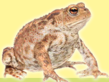
Aantalstrend Padden.nu gewone pad (2008-2024): matige afname