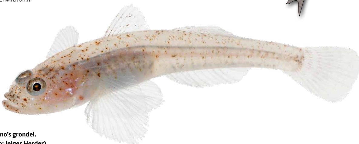
Lozano's grondel.