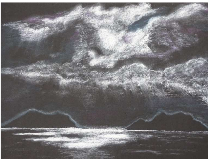
South Georgia - pastelkrijt op zwart papier