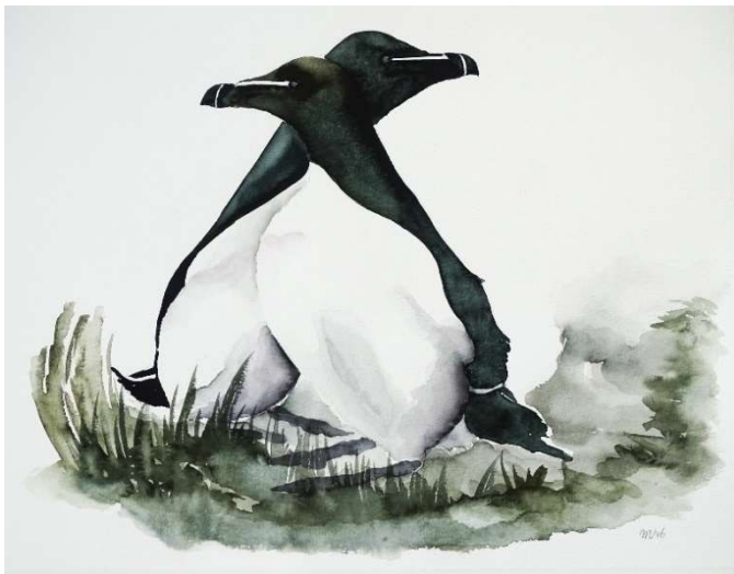
Alken - aquarel