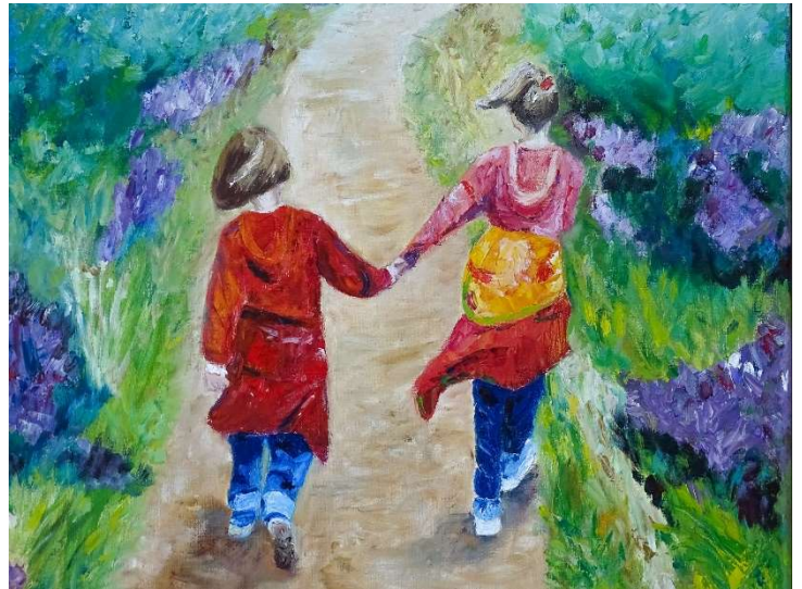
Meisjes van Verkade - olieverf

Mijn ouders woonden op het platteland waar de “natuur” nooit ver weg was. Tijdens mijn studie archeologie heb ik mij gericht op de ecologische kant van onderzoek, dat wil zeggen het onderzoek van zaden en botmateriaal uit opgravingen. Daarmee doe je ook kennis op over de betreffende planten en dieren. De natuur is voor mij dan ook zeker een bron van inspiratie. Daarnaast vind ik ook inspiratie in leuke of mooie foto's die niets met de natuur te maken hebben, zoals onze 'meiden' die voor ons uitlopen.