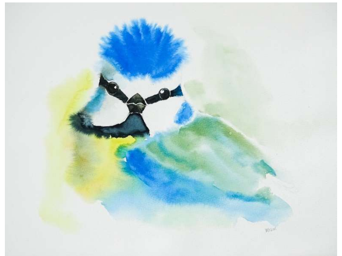
Pimpelmees - aquarel