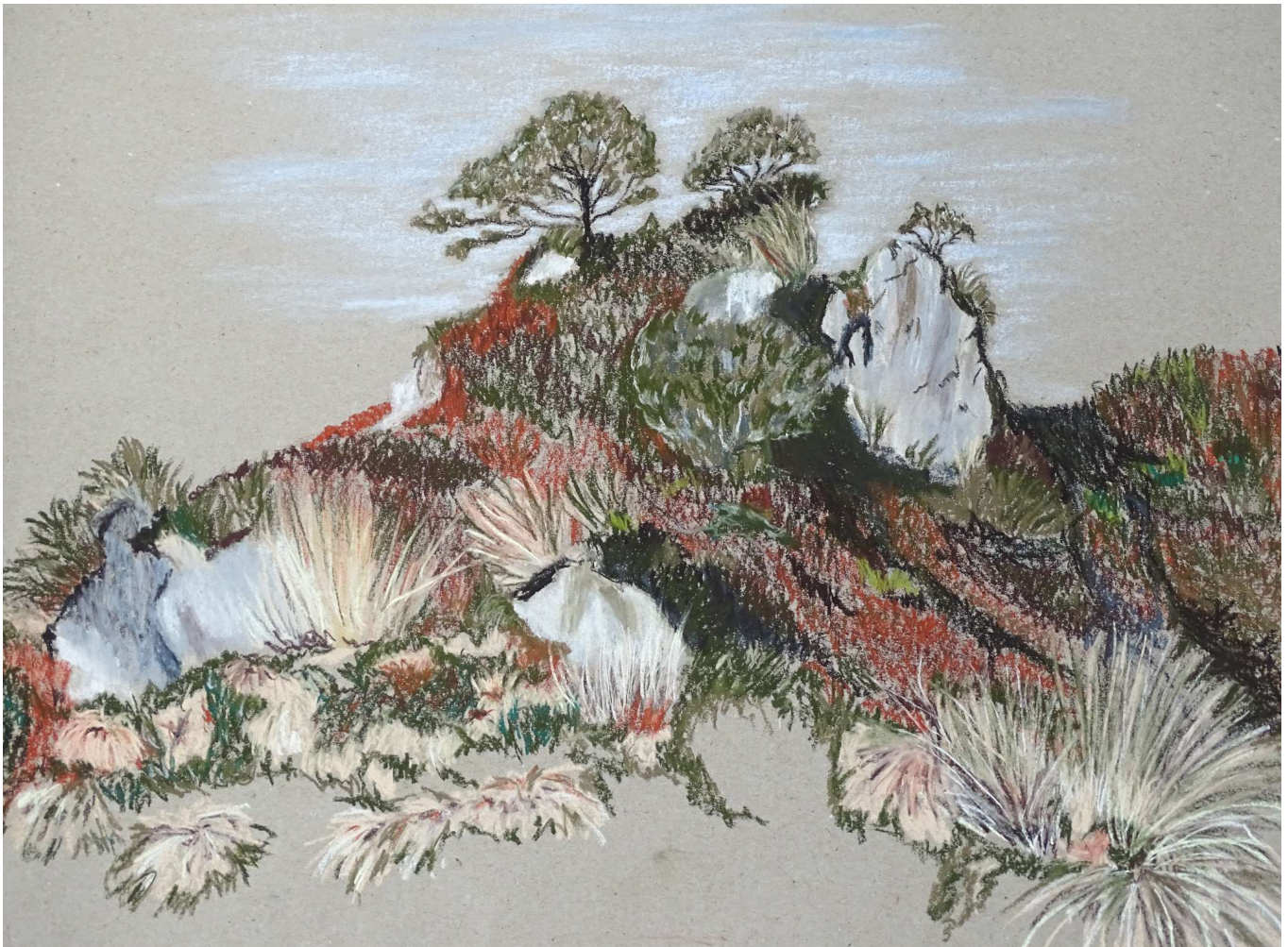
Gough - pastelkrijt