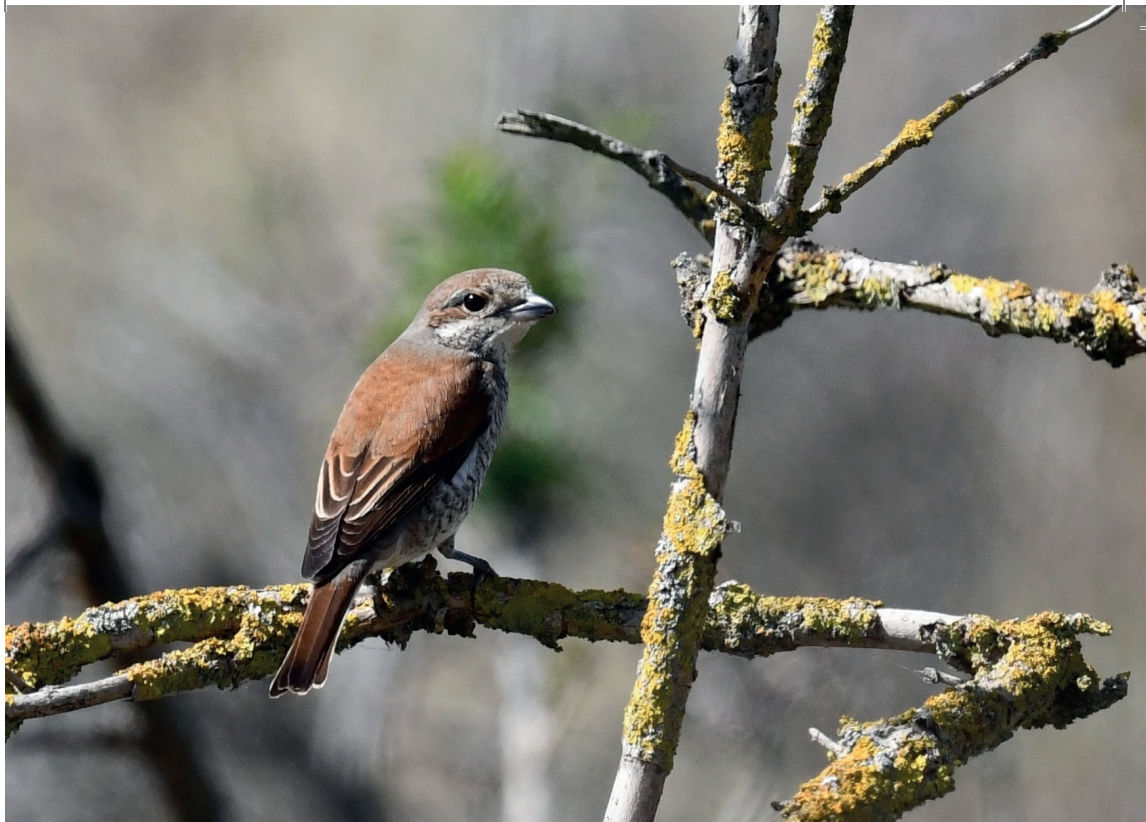
GRAUWE KLAUWIER vrouwtje, 17 juni 2023, AWD.

de was. Op 12 mei werd er eveneens een man Grauwe Klauwier gezien in de AWD. Ook deze vogel leek een territorium te bezetten, later verscheen hier ook een vrouwtje. De dagen en weken hierna verschenen er nog meer Klauwieren in het duingebied. Sommige exemplaren waren na een dag alweer verdwenen, andere vogels bleven voor langere tijd en toonden baltsgedrag, zoals een vogel in Duin en Kruidberg.