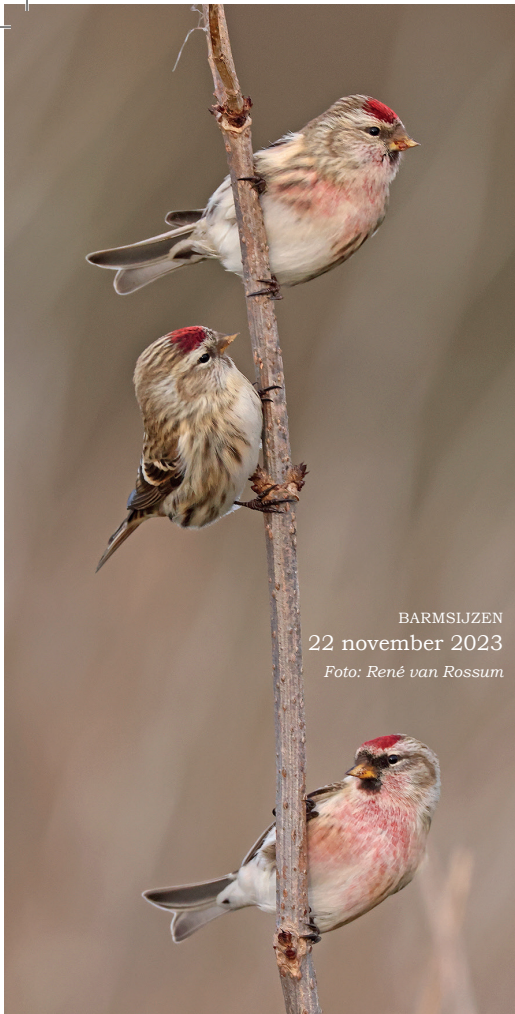
BARMSIJZEN 22 november 2023