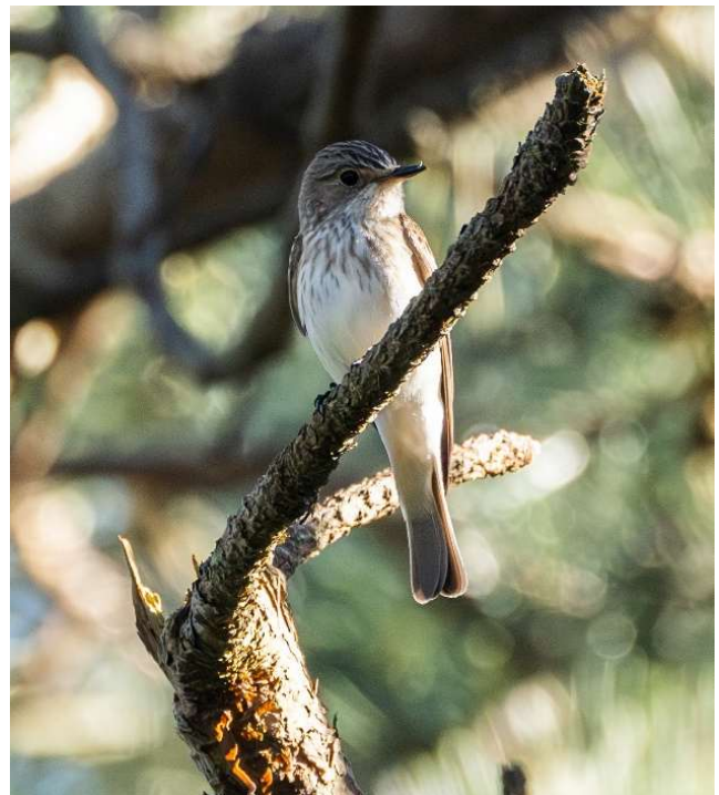
Afbeelding 5: Grauwe Vliegenvanger.