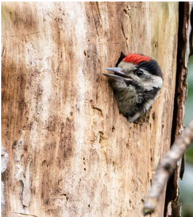
Afbeelding 4: Jonge Grote Bonte Specht bekijkt omgeving.

Wat betreft de zoogdieren hebben we 12 x een Ree geteld, 11 x een Konijn, 1 Haas en 1 Boommarter.