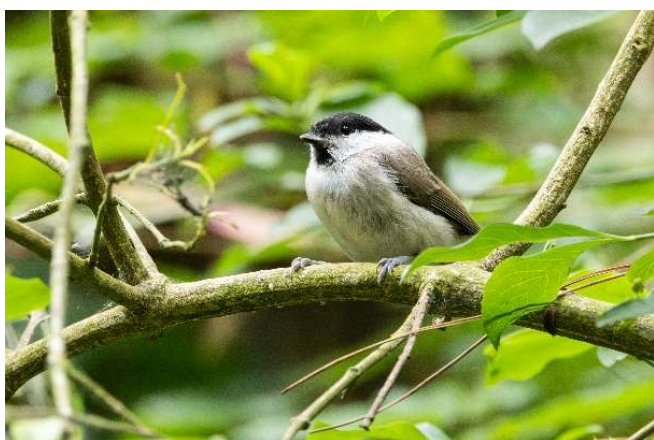
Afbeelding 3: Glanskop die het dit jaar erg goed heeft gedaan.

Het landje van Mesker is onderdeel van Boswachterij Noordwijk. Het gebied is 51 hectare groot. Het is voor publiek toegankelijk en ook voor honden, mits aan de lijn en op de paden. Staatsbosbeheer beheert het gebied. In het gebied liggen verschillende wandelpaden en in het zuidwestelijke deel een mountainbike-route. Aan de westzijde wordt het gebied begrensd door het fietspad en aan de noordzijde door de Duindamseslag.