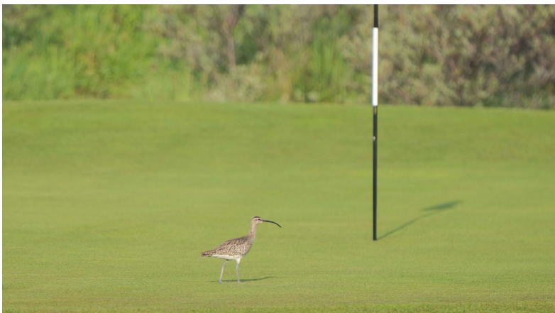
Regenwulp op de green, een zeldzame bezoeker.

Ondertussen is er heel wat veranderd en staat er nog heel wat te veranderen op het terrein van de Noordwijkse golfclub. Er zijn honderden bomen gekapt, holes worden omgelegd, greens vervangen en er komt grijs duin en jong gemengd bos voor in de plaats. We zijn heel benieuwd naar de invloed van deze veranderingen op de tellingen van volgend jaar.