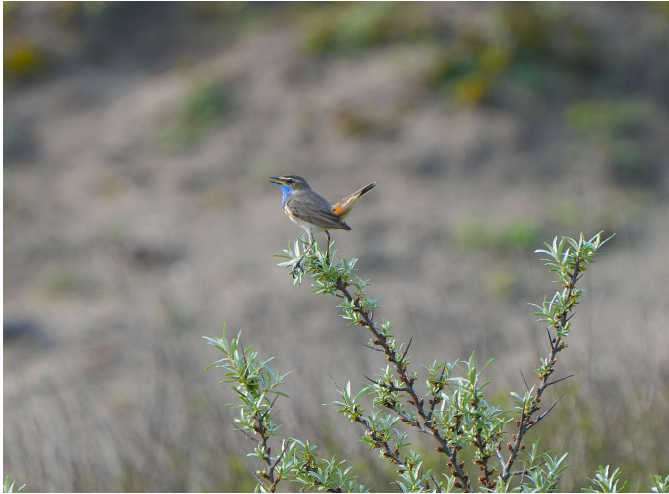
Blauwborst, de eerste op de Golfbaan.

Ook de Blauwborst wist meteen een nieuw ontstane natte duinvallei te vinden. De vogel liet zich meermaals mooi zien en horen. Het betrof het eerste territorium op de golfclub van deze zangvogel die het de laatste jaren goed doet in de duinstreek.