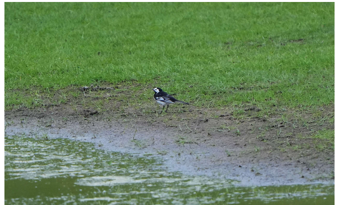
Rouwkwikstaart bracht jongen groot op de Golfbaan.

De Havik liet zich alleen tijdens de eerste bezoeken zien en horen en was druk bezig met het bouwen van een nest. Een baldadig stel Nijlganzen heeft de Haviken echter verjaagd en dit nest overgenomen. Toch bijzonder hoe deze robuuste jager zich door een stel schreeuwende Nijlganzen laat wegjagen!