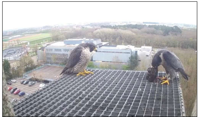
BSV met enkelzijdig geringd wijfje, toren Leeuwenhorst, Gab de Croock, 3 april 2024