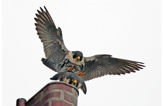
BSV paart met enkelzijdig geringd wijfje, toren Leeuwenhorst, Nico de Graaf, 24 februari 2024.

Alhoewel er druk gepaard werd, kwamen er hier geen eieren; wellicht is zij onvruchtbaar, gevolg van vogelgriep, ouderdom? Het lukt me nét niet om op de binnen-camera de ring af te lezen omdat we met vele storingen te maken kregen.