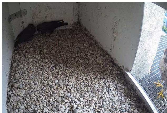
Rond de toren van Leeuwenhorst werd het steeds stiller. Een enkele keer nog bezoekt het vrouwtje de toren waarbij de Kauwen soms angstige momenten beleefden omdat ze aannamen dat de nestkast verlaten was. Ze heeft ze zo een kwartier in angst laten zitten. Rob Jansson, 18 augustus 2024.