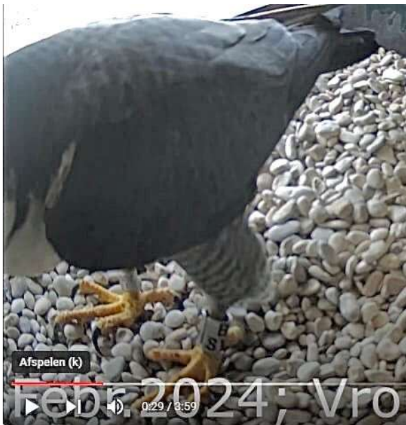
Videostill genomen door Yvonne van der Maat uit het YouTube filmpje van Hoofddorp, man BSV op 6 maart 2024 !

Hartelijk dank aan Yvonne voor haar oplettendheid! In Hoofddorp heeft man BSV een succesvol broedsel waaruit twee jongen voortkomen. Hij besluit echter half mei hier te vertrekken en het wijfje met de kleine juvenielen achter te laten, waardoor zij er alleen voor komt te staan.