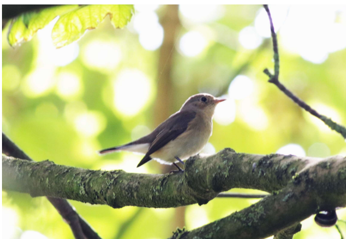
Kleine Vliegenvanger – 21 september 2024 Noordwijk - Willem v.d. Bergh (Stichting) © Wijndeldt Boelema

passeerden er dagelijks één of twee ons waarnemingsgebied (WBo ea). De laatste vloog op 14 september over de Coepelduynen (BW). Over het Kachelduin trokken op 6 september 5 Visarenden (EM). De volgende dag volgde nog een Visarend en een Morinelplevier (EM). De Visarend werd ook op de Puinhoop opgepikt (RR ea). In totaal trokken er deze maand minimaal 15 Visarenden over ons waarnemingsgebied. De oostenwind van 21 september leverde op de telpost Kachelduin een Velduil , 2 Grote Piepers en een Duinpieper op (EM). Op 29 september trok er een Siberische Boompieper over (EM AM). Over de Puinhoop trok op 1 en 7 september een Morinelplevier (PS HL NM ea) en op 22 september een Roodkeelpieper (RR ea). Op 9, 18 en 21 september vloog er een Morinelplevier over de AWD (JDu ea). Een vroege Grote Pieper vloog op 3 september over de Coepelduynen (CZ). Op 21 september vlogen er in de loop van de ochtend drie over (CZ ea). Op 29 september volgde er nog één (JHa) en op 30 september één over de Luchter Zeeduinen (KZ).