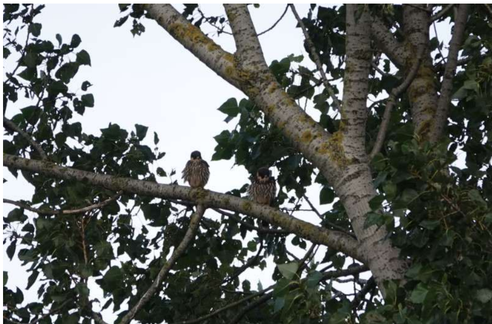
Boomvalk – 24 augustus 2024 Katwijk aan Zee - Hoornes

Wilde Eend en Kleine Plevier (LS). Na de vestiging in 2019 zijn er jaarlijks territoria van de Nachtzwaluw in de Noordduinen. Van 2-3 in afgelopen jaren sprong het aantal naar maar liefst acht dit jaar (LS).