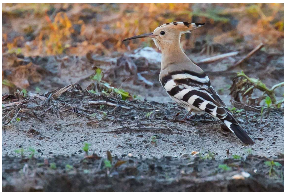
Hop – 13 september 2024 Voorhout - Elsgeesterpolder