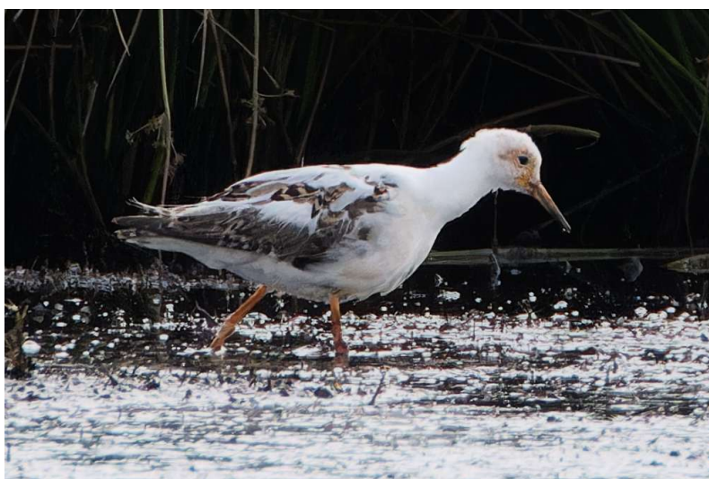
Kemphaan – 1 juli 2024 Amsterdamse Waterleidingduinen – Westhoek

De maand juli was net als de voorafgaande maand relatief koel en er bleef veel regen vallen. In de eerste helft van de maand was er een aanhoudende westelijke stroming, met op sommige dagen veel wind. Vanaf de 19 e kreeg het weer een meer zomers karakter en zat de wind vaker in het oosten en zuidoosten, nog steeds afgewisseld met langstreckende lagedrukgebieden.