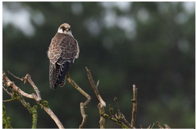
Roodpootvalk - Falco vespertinus (eerste kalenderjaar) Noordwijk - Noordduinen - De Blink

Op 1 september vlogen er 2 Casarca's over het strand van de Noordduinen (RM). Over de Noordduinen en later over de Achterweg vloog een eerstejaars Zeearend (AM EM CZ). De volgende dag was mogelijk dezelfde vogel aanwezig in de zuidelijke AWD (JK CB ea). Deze vloog op uit het Marelvlak. Op 8 september vloog een bijna volwassen Zeearend over de AWD (IW). In de eerste helft van de maand was er een influx van Roodpootvalken in Nederland. Op 1 september waren er op 5 locaties in ons waarnemingsgebied waarnemingen, waaronder een jagen in de Noordduinen (EM) en verblijvend in Oud Leeuwenhorst (JVr PS). Op 2 september was er een aan het jagen rond het Achterhaasveld in de AWD (SP ea) en een in de Coepelduynen (ML ea). Van 5 t/m 9 september