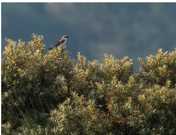
Grauwe Klauwier - (♂ adult) 7 juli 2024 Amsterdamse Waterleidingduinen - Infiltratiegebied

Elders in de zuidelijke Amsterdamse Waterleidingduinen broedde een Grauwe Klauwier . Vanaf 23 juni was er een paar aanwezig (JS). Op 27 juli vergezelde de man een juveniele vogel (GV). Dit is het eerste zekere broedgeval in ons waarnemingsgebied sinds 1982, toen de soort broedde langs het (toen nog) Van Limburg Stirumkanaal. Hopelijk is dit de opmaat voor een verdere hervestiging in de duinen. Bijzonder was ook de Patrijs die met 12 jongen in de zuidelijke AWD liep (MV ea). Samen met het broedgeval dit jaar op de Noordwijkse Golfclub, lijkt dit een aanwijzing dat na jaren van afwezigheid hervestiging van de Patrijs in de duinen niet onmogelijk is.