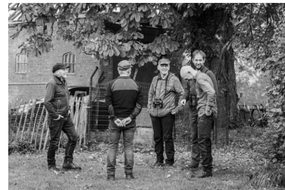
Ondertussen werd er binnen schoongemaakt (JB).

Zondag op tijd uit de veren, ontbijten, inpakken en de boerderij veegschoon opleveren.