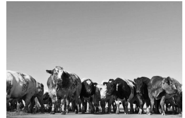
De verzamelde koeien (Chris Sandkuijl).

Moe maar voldaan werd er besloten dat het vogelweekend dan toch afgelopen was.