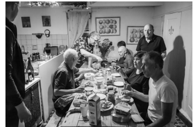
Gezelligheid in de keuken (JB).

Voor de één oude meuk, voor de ander een nostalgische overnachting. De bedden waren goed en zelfs in de bedstee werd er geslapen. Het mocht de pret niet drukken dat niet iedereen in de keuken paste en dat na aanpassingen iedereen in de woonkamer hutjemutje zat. De keuken had een vaatwasser, dus niemand hoefde zijn snor te drukken.