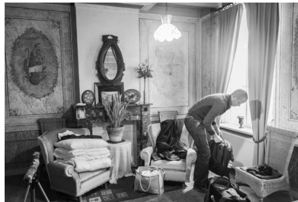
In ons verblijf De Appelgaard bij Zaamslag (JB).

Het is ongelooflijk zacht najaarsweer met nagenoeg geen wind. Ideaal om eens goed de tijd te nemen voor de vogels. Bij de polders van Het Verdronken Land van Saeftinghe en Het Verdronken Land zelf zaten ganzen, Baardmannen, diverse eendensoorten en veel Bruine Kiekendieven. Verderop langs de Schelde kwamen de steltlopers aan bod: Wulp, Grutto, Rosse Grutto, Scholekster en Steenloper. Het verplaatsen liep gesmeerd dankzij het aangeven van de GPS-locatie in WhatsApp. Zo kon iedereen zonder te moeten zoeken de volgende plaats vinden.