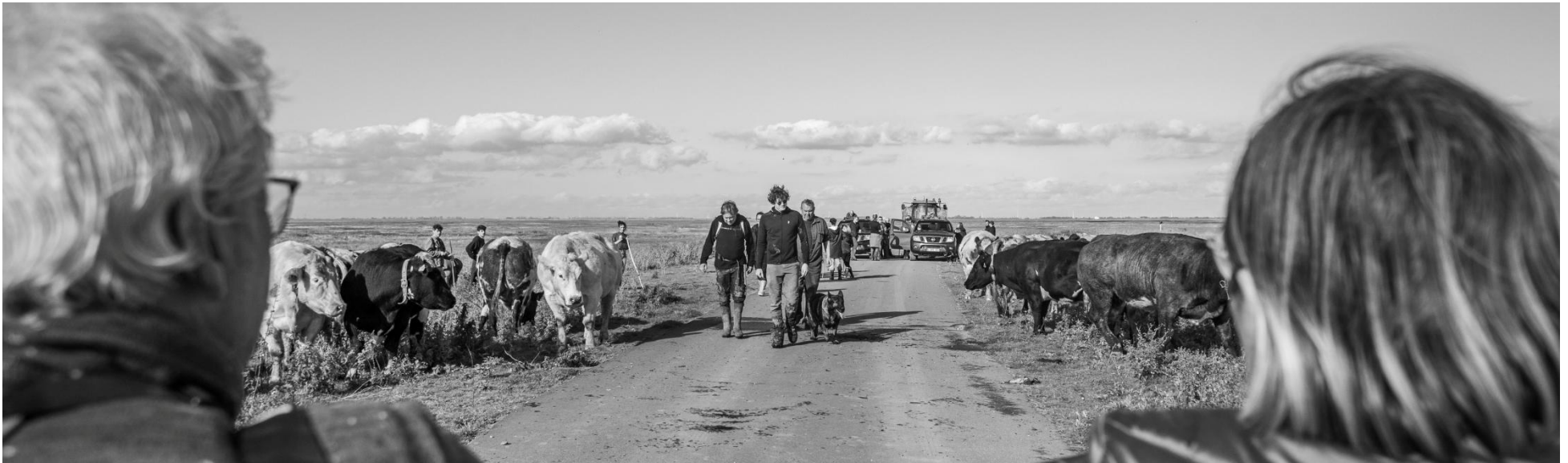
De koeien worden binnengehaald (JB).

toch niet? De boeken en de apps erbij en overleggen maar. Vervolgens landinwaarts nog even natte voeten halen en Reeën spotten om daarna op het terras van een gesloten café toch wat te gaan drinken. Prima gelukt, zo lekker in de zon.