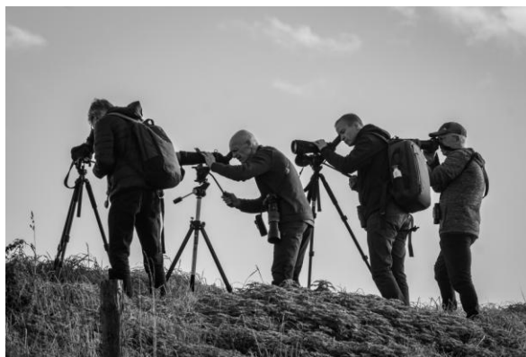
Turen vanaf de dijk (JB).

Zaterdag begon met zware mist. We zijn iets later van de boerderij vertrokken. Dat was geen straf, want ook hier was genoeg te zien. Zelfs de Goudhaantjes waren hier vertegenwoordigd.