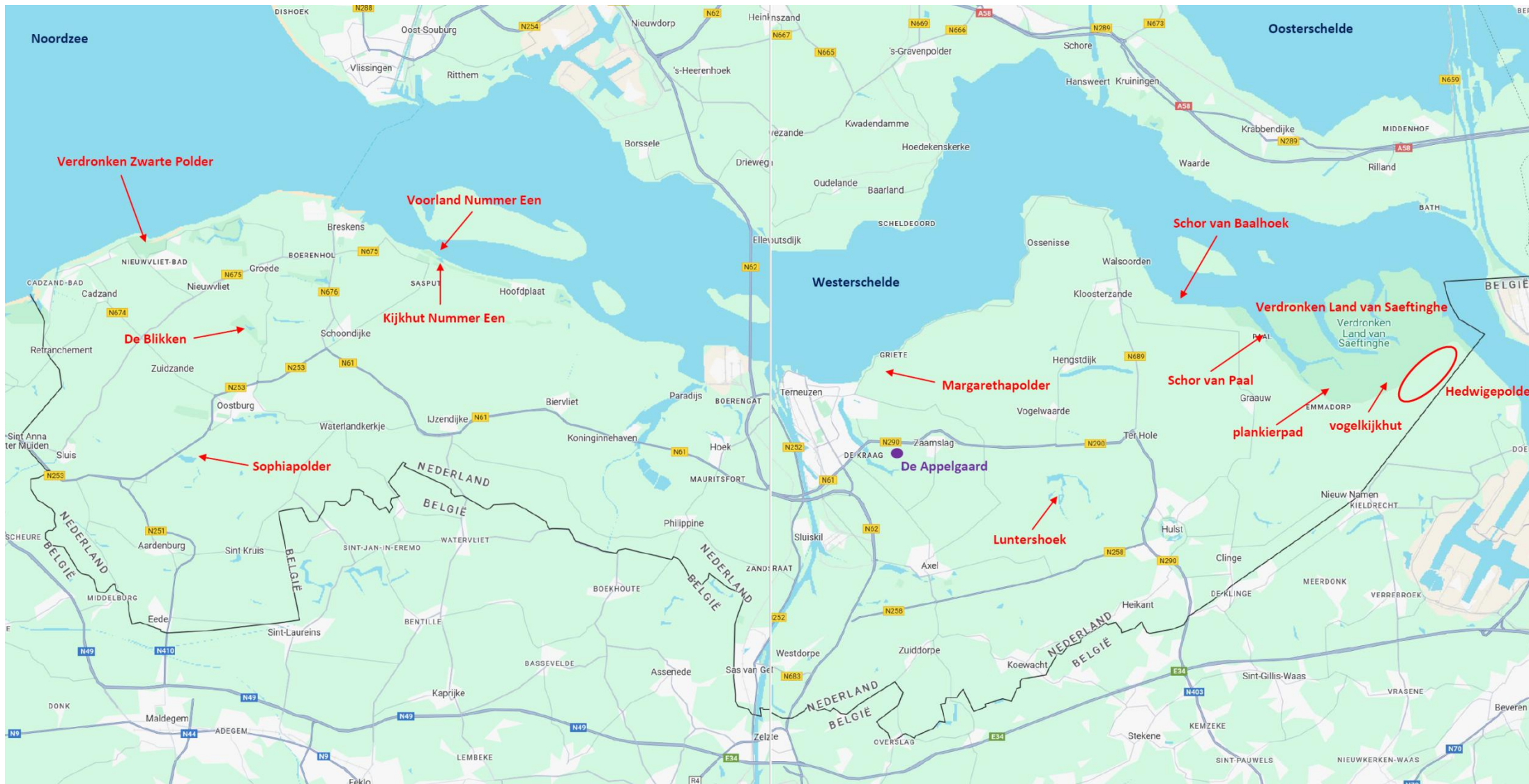
In rood de gebieden die we tijdens het VWG-weekend bezochten.