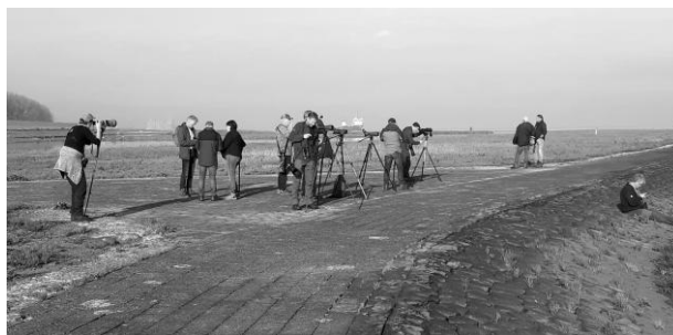
Voorland Nummer Een (Connie Neutkens).

Aangekomen bij de kijkhut op de dijk bij Nummer Een liep er tot ieders verbazing een wandelaar met grote Bouvier door het beeld. Wat doet die man daar? De ganzen gaven geen kik. Waarom zijn wij daar eigenlijk niet? Zo gezegd, zo gedaan. Konden we mooi aan het water van de Schelde vooruit met de kijkers en de camera's. Maar pas op voor schuine en bijzonder gladde kantjes!