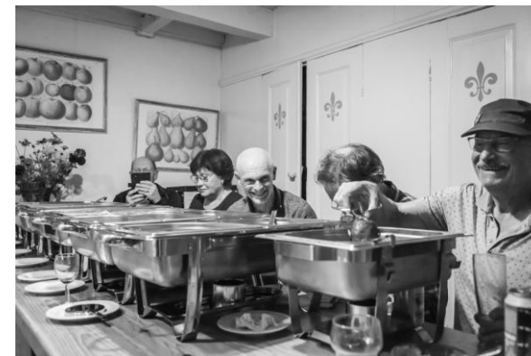
Aan de stamp (JB).

's Avonds werd het eten voor ons verzorgd: een geweldig stampottenbuffet, met gehaktballen zo groot dat ze al een maaltijd op zich waren. Wijn en bier vloeiden rijkelijk en de avond duurde voor sommigen tot in de late uurtjes.