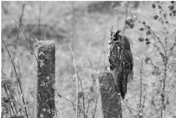
Bingo, een Ransuil (JB).

Bingo! We komen ongeveer als laatsten aan, maar hebben dan ook wel wat te vertellen. Twee minuten voor aankomst bij de verzamelplaats is het raak. We zien een Ransuil op een paaltje zitten. Even verderop stoppen en uitstappen. Die hebben we alvast. Dit is een superstart van een geweldig vogelweekend.