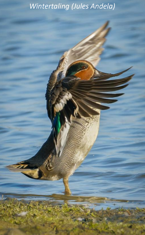
Wintertaling (Jules Andela)