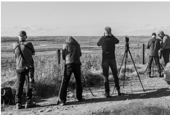
Het Verdrongen Land van Saeftinghe (JB).

toch niet? De boeken en de apps erbij en overleggen maar. Vervolgens landinwaarts nog even natte voeten halen en Reeën spotten om daarna op het terras van een gesloten café toch wat te gaan drinken. Prima gelukt, zo lekker in de zon.