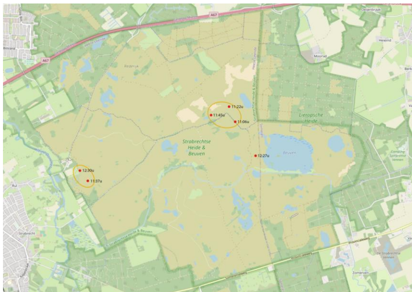
Waarnemingen van Klapekster op 4 januari 2025 met clustering, resulterend in 3 exemplaren. Op de kaart is ook een losse waarneming uit waarneming.nl verwerkt.