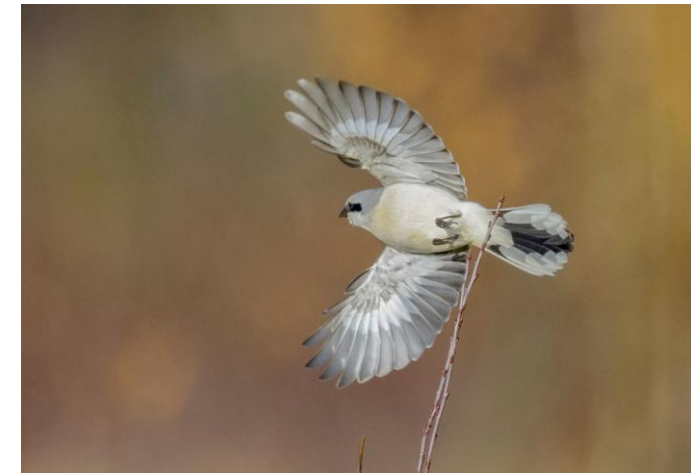
Klapekster op het Kranenveld, 21 november 2022.