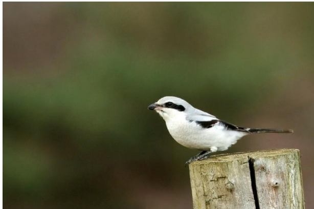
Klapekster op het Kranenveld, 24 november 2024.

Kwam het door ons geslaagde jubileumfeest of waren het de droge omstandigheden na wat regenachtige weken, er werd i.i.g. enthousiast aangemeld voor de 36e editie van onze eerste telling in het nieuwe jaar, op 4 januari 2025. Daardoor had de organisatie weer aardig wat voeten in de aarde. Dit jaar was de medewerking van Staatsbosbeheer op tijd geregeld, alle vaste tellers waren benaderd en bevestigd. Maar tot een dag van tevoren meldde mensen zich aan, waarbij het niet helpt dat er verschillende vertrekpunten zijn en niet iedereen op dezelfde tijd start op de parkeerplek.