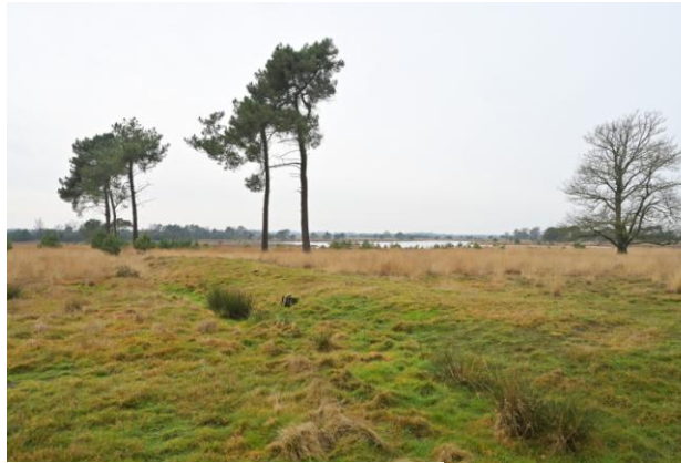
Bij het Grafven , 4 januari 2025 (TH).

en alle tellers bedankt voor de enthousiaste deelname.