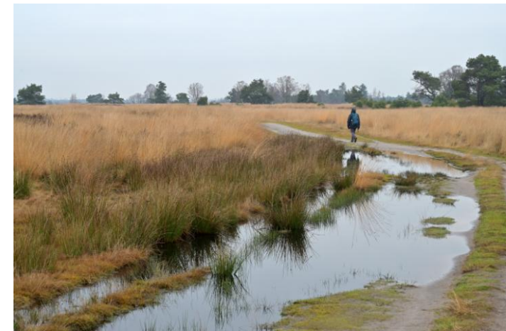
Tijdens de telling van route B, 4 januari 2025 (TH).

Allemaal leuk, maar de Klapekster komt zometeen pas. Uiteraard een stop bij het Beuven, hier is een heel nieuw zandpad aangelegd om de kijkhut droog te bereiken wat op het einde nog moeite kost. Tussen vele Kuif- en Tafeleenden vind ik zo snel geen Brilduiker. We gaan door, maar aangekomen bij de noordwesthoek van het Beuven en samenkomst van twee routes nog steeds geen Klapekster.