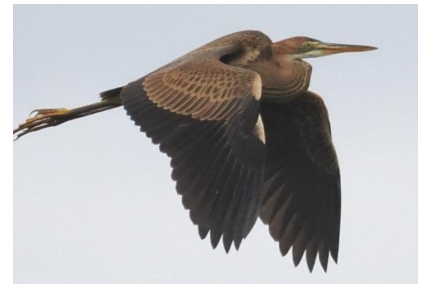
Purperreiger op de Landschotse Heide, 9 augustus 2024 (Peter Simon).