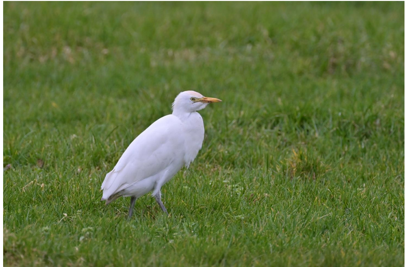
Koereiger westelijk van Waalre, 30 januari 2024 (TH).

Biesbosch, de Oostvaardersplassen en het plasseengebied tussen Steenwijk en Zwartsluis. Over de grens zijn in westelijk België eveneens grote clusters van waarnemingen te vinden. ■