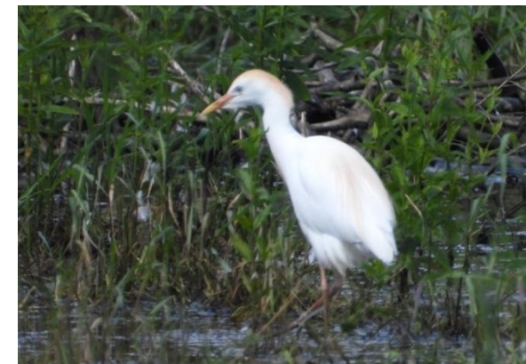
Koereiger ten zuiden van Valkenswaard, 7 juni 2024 (Frank van Daal).

Deze soort is niet gebonden aan natte omstandigheden, maar voor de volledigheid van de Ardea en Egretta reigers volgen hier de waarnemingen. In de zomer en nazomer van 2024 werden Koereigers gemeld bij Wintelre (4 juni), onder Valkenswaard (7 juni) en op de Landschotse Heide (22 juni).