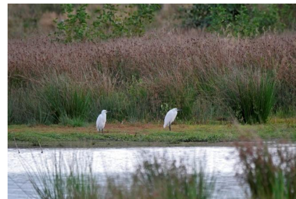
Kleine Zilverreigers in het Achtereinds Laag, 13 september 2024 (TH).

Deze soort wordt de laatste jaren steeds vaker in de Kempen gezien, met als voorlopig hoogtepunt 2024. Nadat in april,