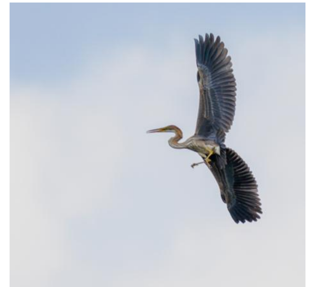
Purperreiger op de Landschotse Heide, 17 augustus 2024 (Ron Schipper).

In de periode augustus t/m half september was het bijna dagelijks raak (zie tabel op de volgende pagina). Vooral op de Landschotse Heide waren er veel waarnemingen van pleisterende vogels, waaronder gegereld 2 ex. Vanaf half september werden Purperreigers alleen gezien bij het Soerendonks Goor (24 t/m 29 september) en Wellenseind (25 september overvliegend).