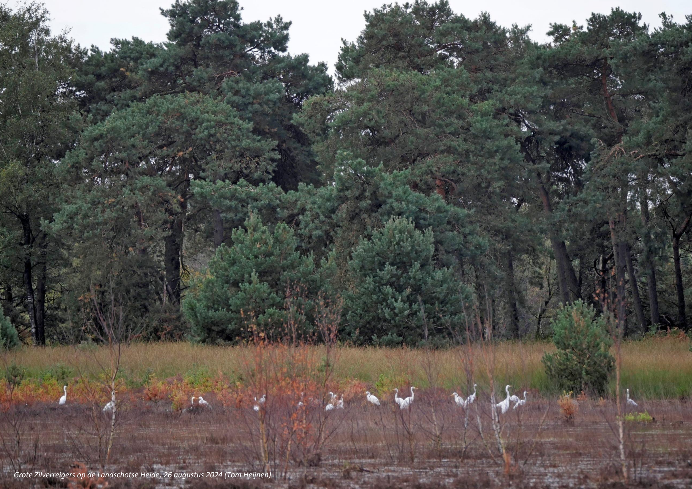
Grote Zilverreigers op de Landschotse Heide, 26 augustus 2024 (Tom Heijnen)