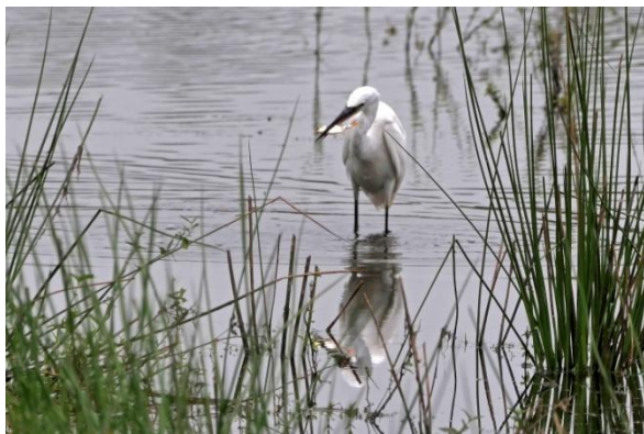
Kleine Zilverreiger met Rietvoorn op het Beleven, 15 september 2024 (TH).

mei en de eerste helft van juni enkele vogels werden gezien, waren de waarnemingen vanaf medio juni talrijker.