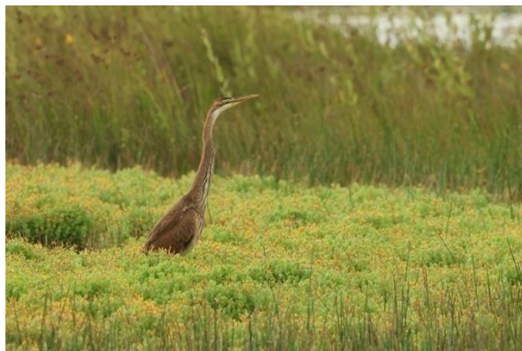
Purperreiger op de Gastelse Heide, 26 juli 2024 (Bjorn Alards).

Het was een uitzonderlijk goed jaar voor Purperreigers. De eerste vogels vanaf 1 juni werden opgemerkt op 19 juni (Ringselvennen), 13 juli (onv. Diessens Broek), 26 juli (onv. Gastelse Heide) en 31 juli (onv. Landschotse Heide).