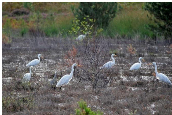
Grote Zilverreigers op de Landschotse Heide, 26 augustus 2024 (TH).

Tegenwoordig kunnen Grote Zilveren in een groot deel van de Kempen worden aangetroffen. Op slaapplaatsen komen soms grote aantallen (tot 70 ex) bijeen, maar overdag komen concentraties van 20 vogels zelden voor.