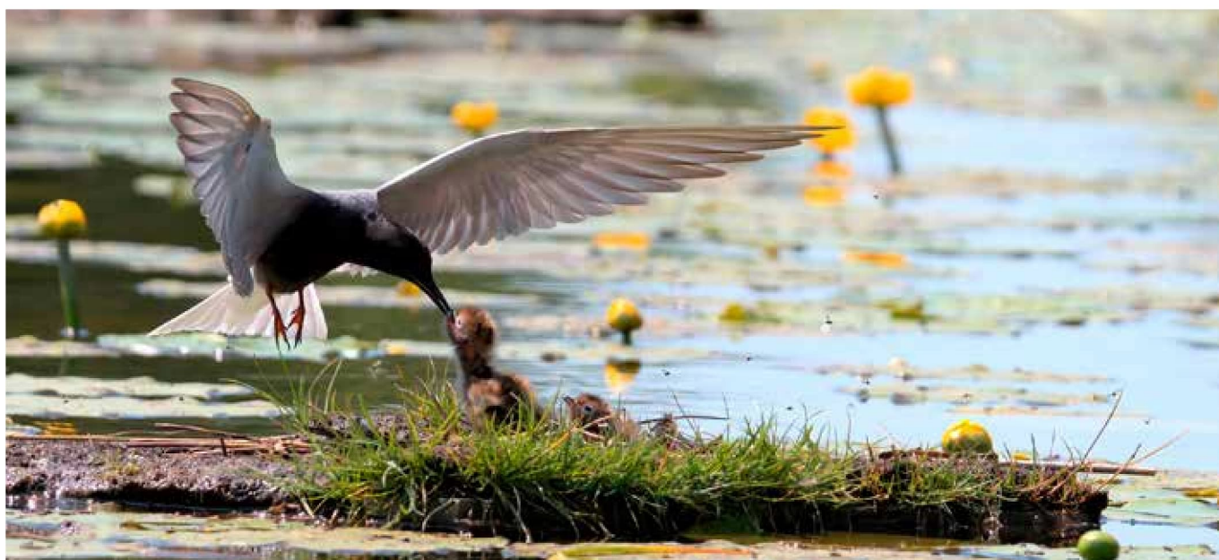
Zwarte Stern, 4 juni 2023, Kortenhoef