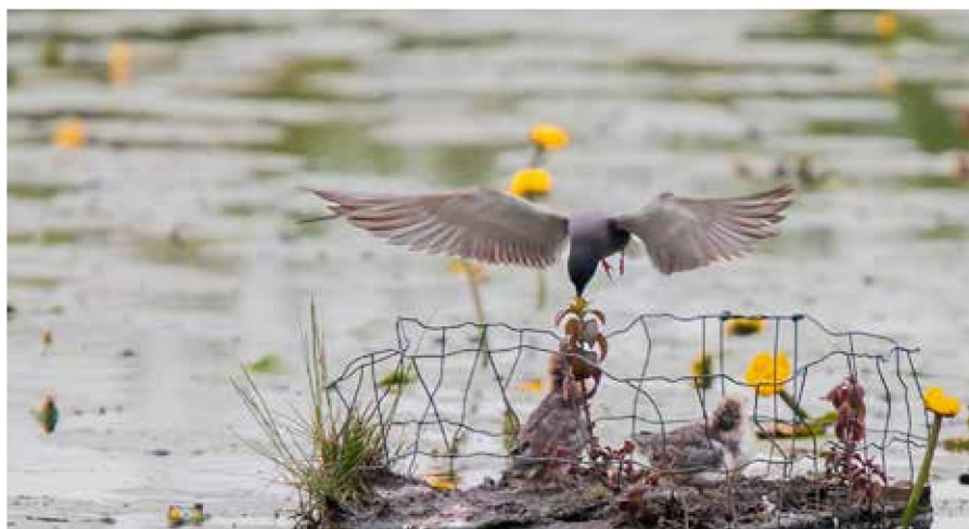
Zwarte Stern, 20 juni 2024, Westbroek

Loosdrechtse Plassen, met name de Vijfde Plas, is de dichtstbijzijnde plek om de Zwarte Stern bij de nesten bezig te zien. Soms kan je de Zwarte Stern als doortrekker op diverse plekken in ons werkgebied zien. Boswachter Angelique Aerts (Natuurmonumenten) vertelde in een interview in de Gooi & Eemlander (17-11-21) dat het landschap aan de noordkant van het Naardermeer meer open is gemaakt. Watersnippen en het Bokje hadden dit snel in de gaten, maar de Zwarte Stern wacht nog even af. Zit er te weinig dynamiek in het Grote Meer? Er waren wel vlotjes uitgezet.