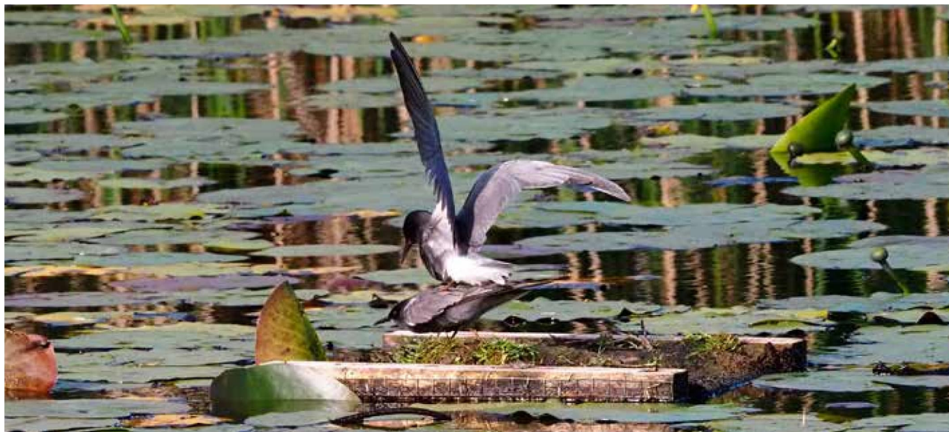
Zwarte Stern, 11 juni 2024, Zouweboezem | Rob Prinzen