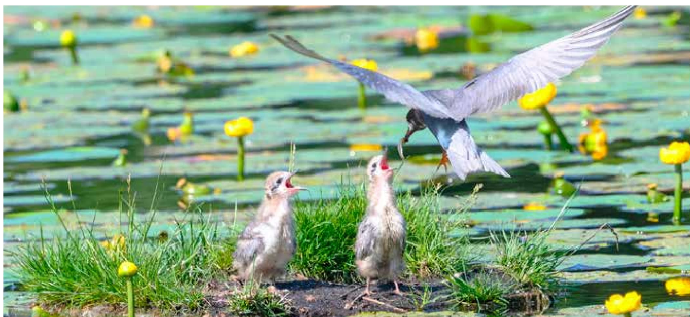
Zwarte Stern voert visje aan kuiken, 23 juni 2024, Kockengen