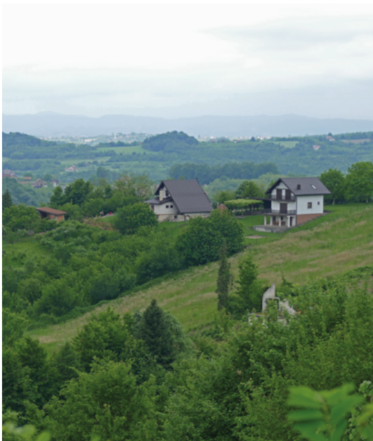
Het huisje bij Doboj en de omgeving.

In Doboj aangekomen, verblijven wij in een huisje relatief hoog op een berg, net buiten de stad. Het huisje heeft een grote tuin en boomgaard. Ook de huizen eromheen hebben eigen boomgaarden of stukken grasland. Het landschap is heuvelachtig/bergachtig. In de oorlog (jaren 90) is er zwaar gevochten in dit gebied. De sporen zijn hier nog steeds van te zien. Huizen waarvan de bewoners nooit