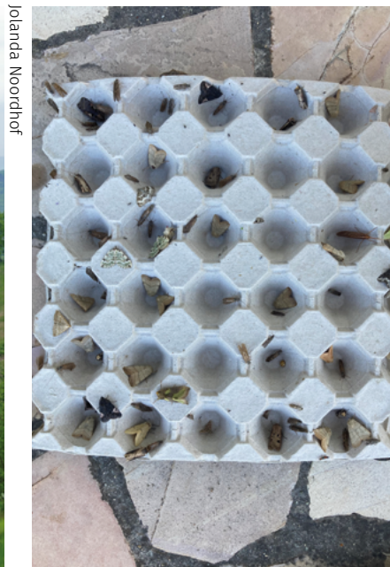
Veel nachtvlinders in de val.