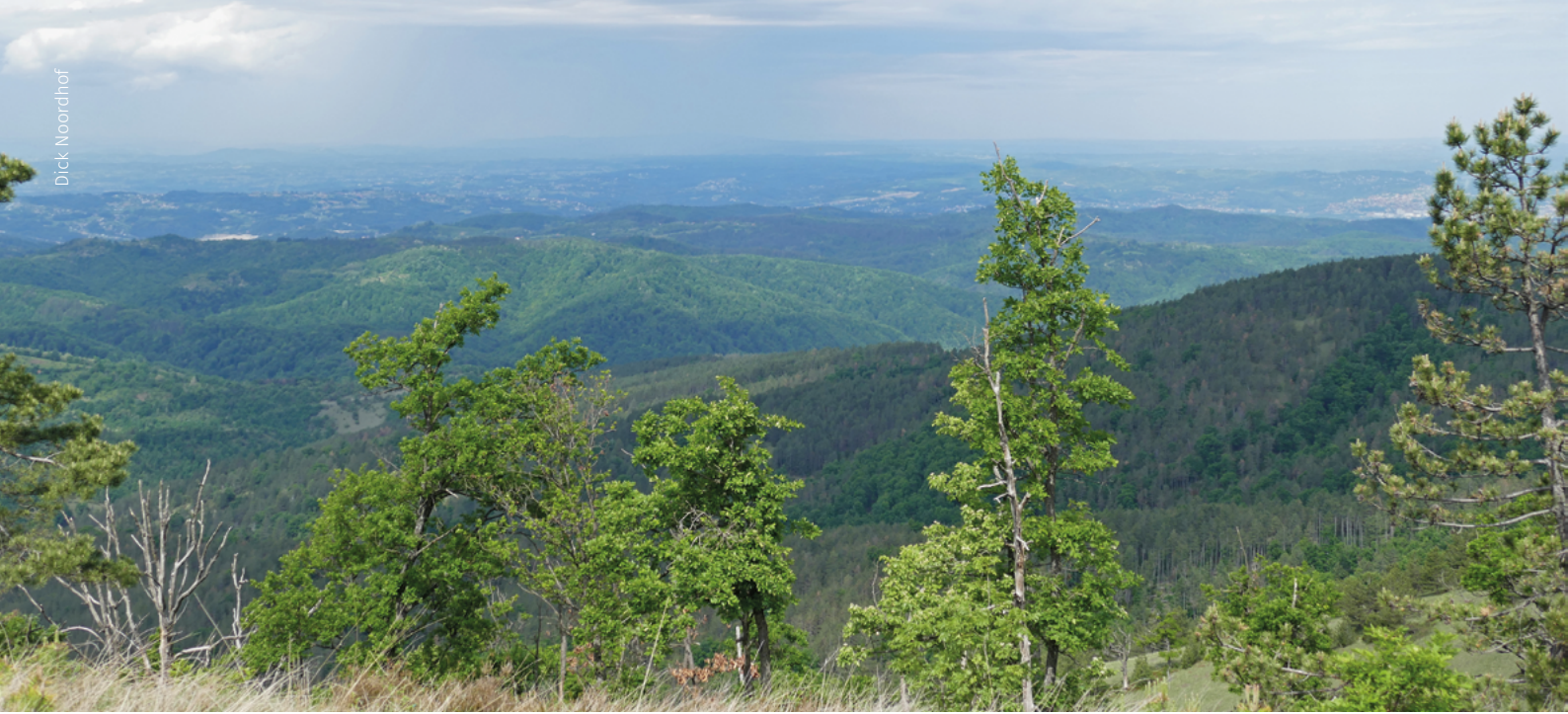
Gostilj, de hoogste 'berg' in de omgeving van Doboj.