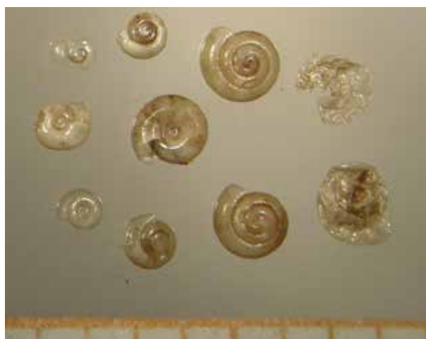
Fig. 2. Aardschijfjes Lucilla scintilla uit Sittard-Geleen. Gereproduceerd uit Kuijper & Van Wijk, 2013.