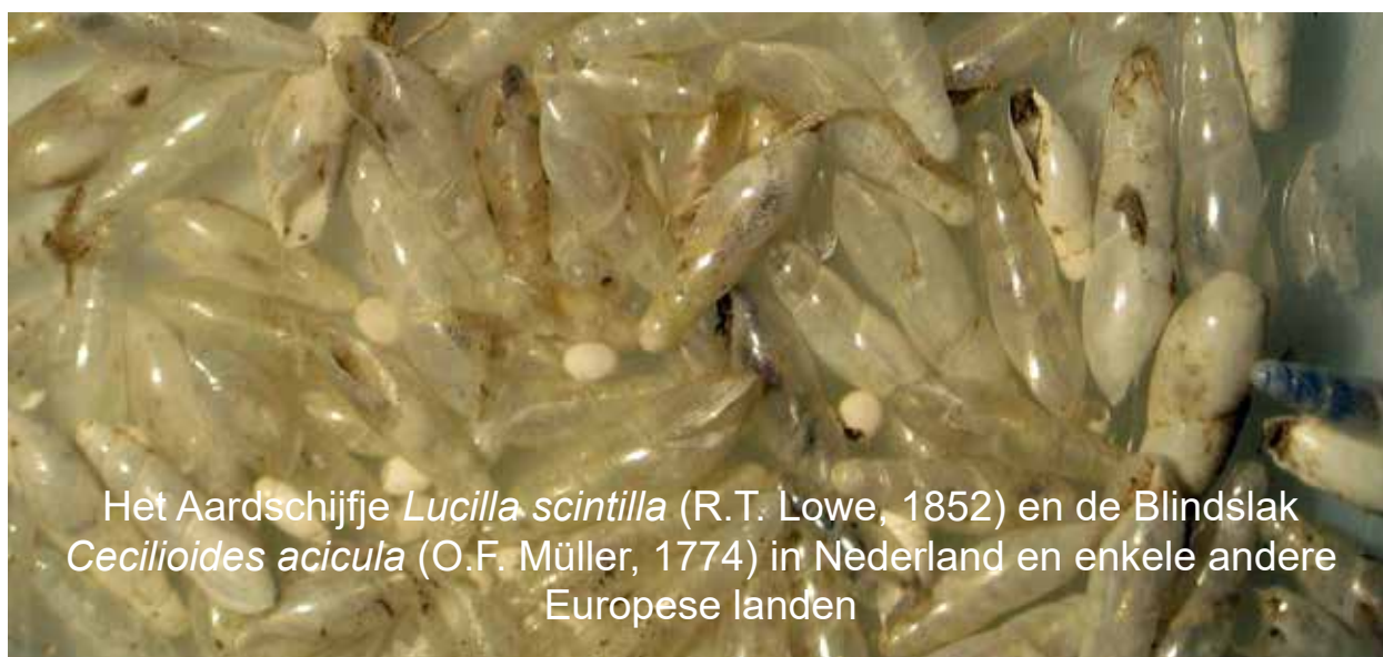
Het Aardschijfje Lucilla scintilla (R.T. Lowe, 1852) en de Blindslak Cecilioides acicula (O.F. Müller, 1774) in Nederland en enkele andere Europese landen