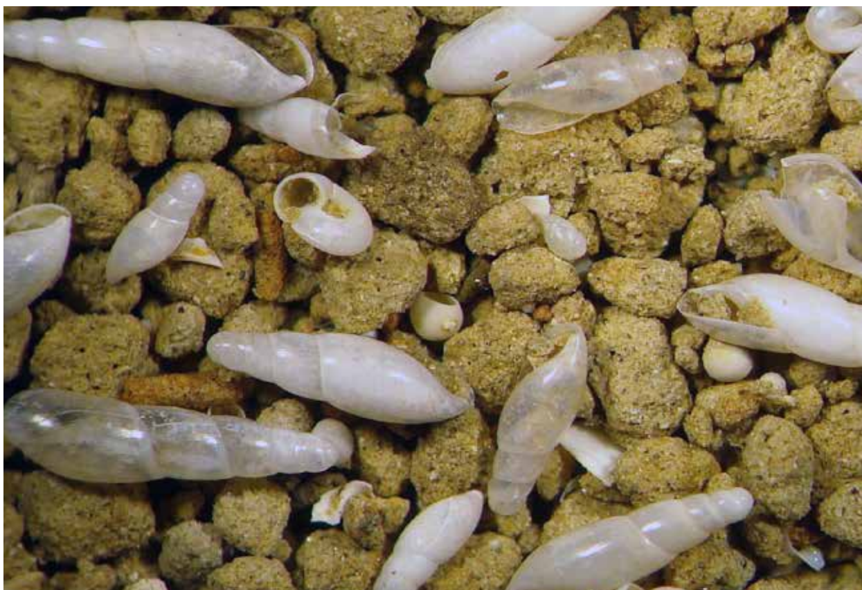
Fig. 3. Residu met Blindslak Cecilioides acicula uit Kloosterzande.

rechter exemplaren). In die gevallen was de bodem waarschijnlijk kalkarm en zullen schelpen niet lang aanwezig blijven.