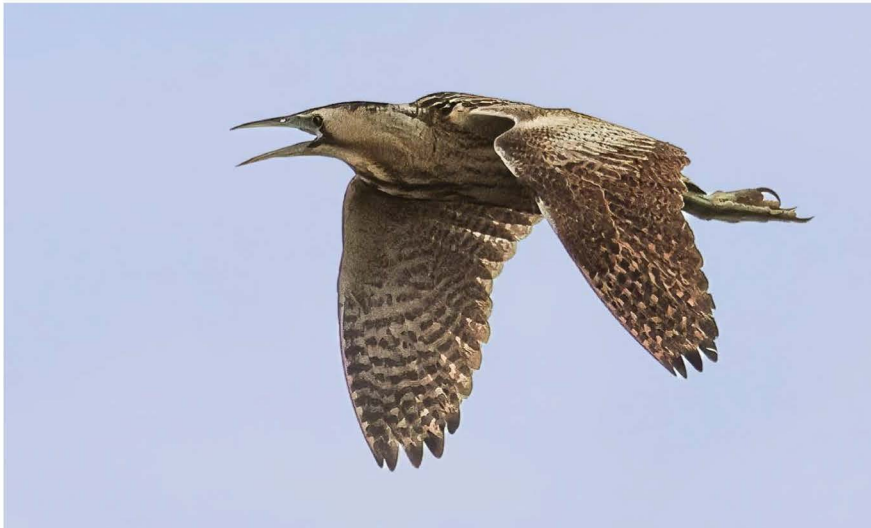
Met wat geluk tref je hier een vliegende Roerdomp

Regenwulpen. Van Kleine Plevieren tot Grote Zilverreigers komen er zoeken naar voedsel in de plas-dras, net zoals Lepelaars. Ook verschillende ruiters zoals Groenpoot- en Bosruiter waden er rond, en zelfs de Kanoet werd er gezien. Meestal vrij in het zicht in het ondiepe water. Zelfs pootkleuren zijn zo te onderscheiden, wat helpt bij de determinatie.