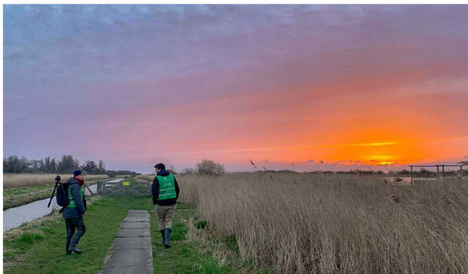
In alle vroegte onderweg om vogels te tellen

teert gelukkig vaak Afrikaanse soorten, dankzij de afwijkende zang is de vogel gemakkelijk te determineren. Verder maak je hier het hele jaar door een redelijke kans om Baardmannen in het riet te horen pingelen.