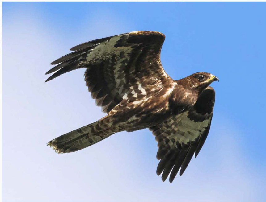
Ook de Wespendief wordt in het trekseizoen regelmatig gezien