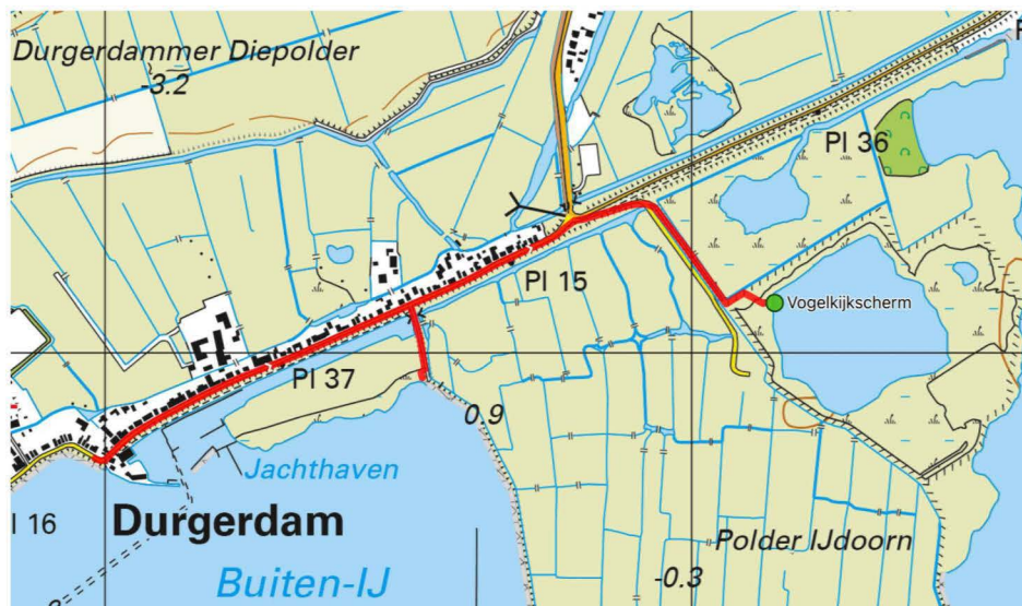
Bij de kruising met de weg naar Ransdorp steek je de Dijk over naar Polder IJdoorn

naar natuurgebied. De weg was vrij voor de definitieve herinrichting, vooral gericht op het kunnen reguleren van de waterstand. Een hoge waterstand moest, samen met een op weidevogels gericht beheer, zorgen voor een topweidevogelgebied. Het heeft helaas nog niet tot de gewenste resultaten geleid, het aantal broedparen blijft dalen. In de lente van 2024 hebben Kievit, Grutto en Tureluur pogingen gewaagd, maar het broedsucces was door een heel natte en koude lente ook dit jaar laag. Wel waren er pullen van de Kievit te zien; je kon ze vanaf de dijk goed zien scharrelen tussen de pollen gras. Tussendoor hipten Witte Kwikstaarten en Graspiepers rond. Zou het hen gelukt zijn om legsels groot te brengen? In de winter verblijven hier grote groepen Brandganzen en Grauwe ganzen. Ook Kolganzen en Kleine Zwanen bezoeken het gebied om zich op de vlakke akkers tussen de slotjes tegoed te doen aan het gras. Omdat de weides