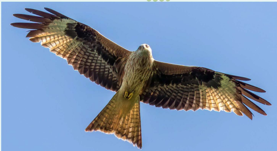
Op 14 mei vliegt er een Rode Wouw over Ouderkerk aan de Amstel

(Fred Scholte). In de periode tussen 14/5 en einde kwartaal wordt regelmatig het geluid van Kerkuil opgenomen op de Vijfhoek (MB). Op 28/5 staat er 1 op een geluidsrecorder in de Rivierenbuurt (MB) en op 26/6 in de Watergraafsmeer; “3x roepend” (GvD). Jonge Bosuilen worden gemeld vanuit het Amsterdamse Bos, de Volkstuinen te Duivendrecht en VTC Amstelglorie. Jonge Ransuilen worden waargenomen in de Brettenzone, Geuzenveld-Slotermeer, bij de Nesciobrug, Osdorper Binnenpolder, Westerpark, A'dam-Zuidoost, en het Ilperveld. Opvallend is een Steenuil die gefotografeerd is op een tuinhokje in Osdorp op 28/6 (Jenno Fabriek). De soort heeft een moeilijk broedjaar achter de rug; door het koude en natte voorjaar zijn er in Polder de Rondehoep en omgeving behoorlijk wat legsels niet uitgekomen noch succesvol uitgevlogen. Gebrek aan voedsel kan een reden zijn dat dit uiltje opduikt op een ongebruikelijke plek. Op 1/4 vliegt een Velduil over het Landje van Geijssel (JW) en op 27/4 over het Diemerpark (FvG). De rest van de waarnemingen van deze soort zijn in Waterland.