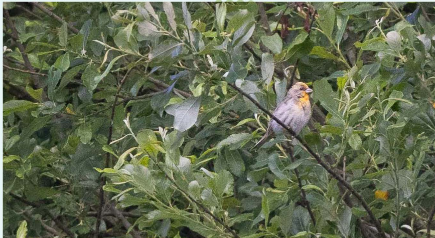
Op 23 juni wordt een Roodmus langs het spoor in Duivendrecht gezien