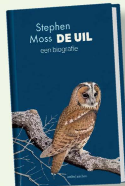
De Uil van Stephen Moss is uitgegeven door Ambo/Anthos en kost € 26,99

Waarom is het toch zo dat uilen door hun lieve ronde hoofd en grote ogen bijna een schattig Disney-figuur lijken, maar tegelijkertijd door de geschiedenis heen veel mensen toch ook de stuipen op het lijf hebben gejaagd? Die vraag staat centraal in het nieuwe boek van de Britse natuurhistoricus, vogelaar, auteur en televisieproducent Stephen Moss, dat in de Nederlandse vertaling in 2024 verscheen met de titel De uil . Een biografie. Dit werk is een toevoeging aan een reeks van 'vogelbiografieën' die deze auteur al publiceerde: eerder bracht hij boeken uit over De zwaluw , Het winterkoninkje en Het roodborstje . Die laatste titel las ik al een tijdje geleden met veel plezier; het is een prachtig boek over een van de meest geliefde en bekende vogels van Groot-Brittannië. Maar met deze uilen-editie heeft Moss het zich wel wat moeilijker gemaakt: in tegenstelling tot het Roodborstje richt hij zijn aandacht nu op vogels die we nauwelijks zien en zelden horen. Tegelijkertijd spreken ze zeer tot de verbeelding. De ambivalentie van deze bijzondere vogelsoort – geliefd maar mysterieus, aandoenlijk en ook angstaanjagend – weet Moss goed over te brengen op de lezer.