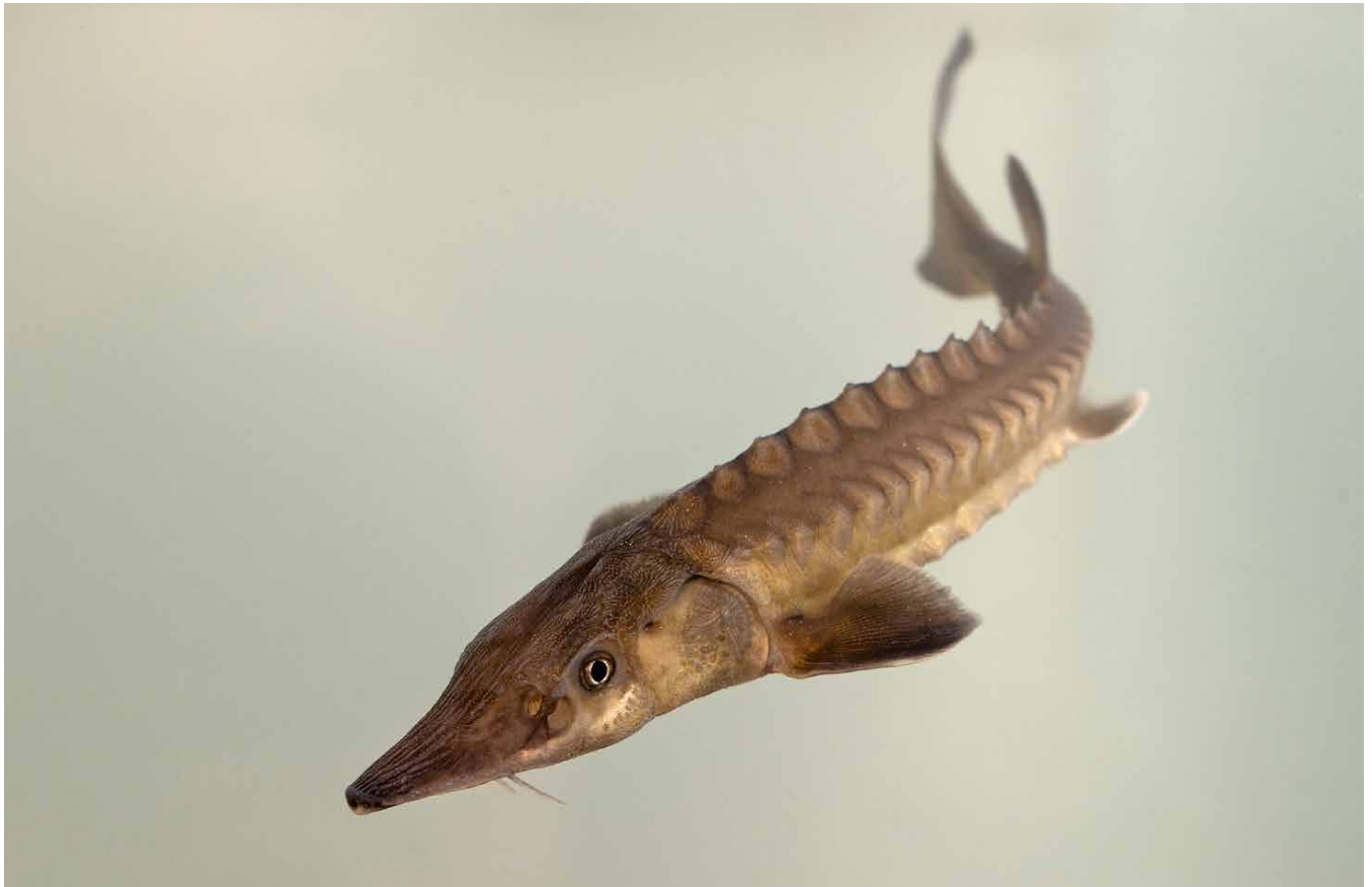
Europese steur.

uitzettingen die afgelopen jaren gedaan zijn. Een belangrijke conclusie is dat jonge steurtjes daadwerkelijk de Noordzee weten te vinden. Uitgezette dieren volgen daarbij telkens de hoofdstroom van de Rijn en trekken via de Nieuwe Waterweg de Noordzee op. Er zijn dus geen onoverkomelijke fysieke barrières. Ook zijn er niet ver stroomopwaarts van Nederland, voldoende paaiplekken met zuurstofrijke kiezelbedden aanwezig. Een volgende stap is een Nederlands opkweekcentrum. Dit past wat betreft timing ook precies in het Actieplan Europese Steur, een door de overheid ondersteund samenwerkingsplan van WWF NL, Sportvisserij Nederland en Ark Rewilding voor de teurgkeer van de steur. Tot nu toe komen alle in Nederland uitgezette steurtjes direct van de MIGADO -kwekerij in Frankrijk. Voor het vervolgonderzoek is het belangrijk dat het steurbroed vanaf jonge leeftijd in Rijnwater opgroeit. De vissen weten dan beter waar ze naartoe terug moeten zwemmen (homing) en ze kunnen alvast wennen aan de omstandigheden in Nederland. Voor deze volgende stap zijn ook RAVON en Diergaarde Blijdorp aangehaakt. Het plan is om in 2025 een eerste opkweekcentrum te creëren in Nederland, direct aan de Rijn en gevoed met Rijnwater. Hierbij wordt gebruik gemaakt van de kennis en ervaringen met opkweekcentra voor steuren in onder andere Frankrijk, Duitsland en Oostenrijk.