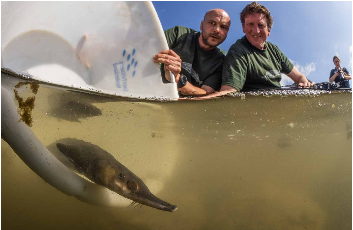
Jonge steur uitgezet in Rijnarm de Waal, 29 augustus 2024.

vorm van tuinieren met soorten? Iedereen die zich lang met steuren bezig houdt, heeft zichzelf deze vraag weleens gesteld. Toch hoeft het antwoord niet ingewikkeld te zijn. Bij rewilding herstellen we de natuurlijke dynamiek van het ecosysteem. Dieren en planten komen dan vanzelf terug is het idee. Dat is een goed uitgangspunt. Op dit moment is de Europese steur echter zo bedreigd, dat het dier niet in staat is om op eigen kracht terug te komen. Sterker nog: als we niets doen gaat de soort geheel verloren en kan dan nooit meer zijn positie in het herstelde ecosysteem innemen. Kweek en herintroductie zijn hiermee laatste redmiddelen om de soort te behouden. Dit is ook niet strijdig met rewilding. Wel is het belangrijk dat de soort zich op termijn zelf kan redden, van ei tot volwassen dier en in alle habitats die deze trekvis in zijn levenscyclus tegenkomt. Uit de voorstudie voor het Rijn actieplan Europese steur die in 2017 werd uitgevoerd (Kranenbarg et al. , 2018) en uit resultaten van de uitzettingen van afgelopen jaren (Breve, 2024) blijkt dat er tot nu toe geen onoverkoombare hindernissen gevonden zijn voor permanente herintroductie. Meer onderzoek is nodig voor een definitieve uitspraak, maar vooralsnog staan de lichten op groen.