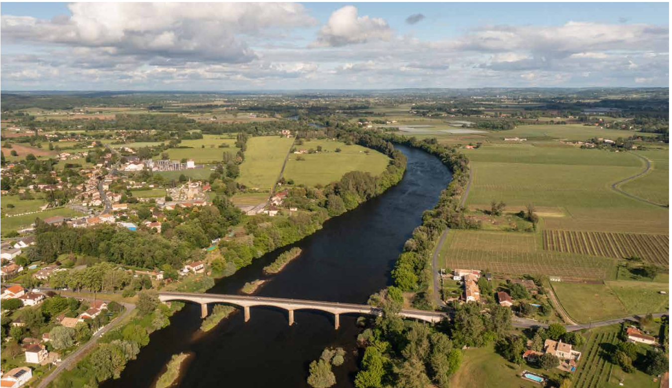
Leefgebied van een kleine relictpopulatie Europese steur in de Dordogne in Frankrijk.

De Europese steur is door menselijk toedoen uit de Rijn verdwenen. Als de steur terugkomt, zal dat ook door menselijk toedoen zijn. Is een actieve herintroductie van een soort met dieren uit een kweekcentrum eigenlijk wel de goede weg? Moet het dier niet uit zichzelf terugkomen en de Rijn herkoloniseren? Hoe weten we zeker dat het ecosysteem klaar is voor de steur? Is herintroductie met andere woorden geen