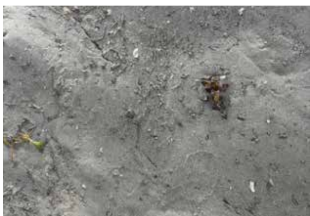
Fig. 6. Foto van de bodem op één van de vindplaatsen van Murchisonella spec. ('Vreemde speldhoren').