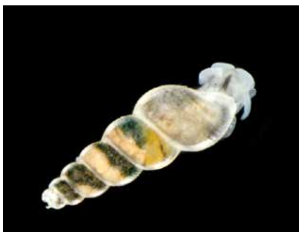
Fig. 4. Een levende Murchisonella spec. ('Vreemde speldhoren').