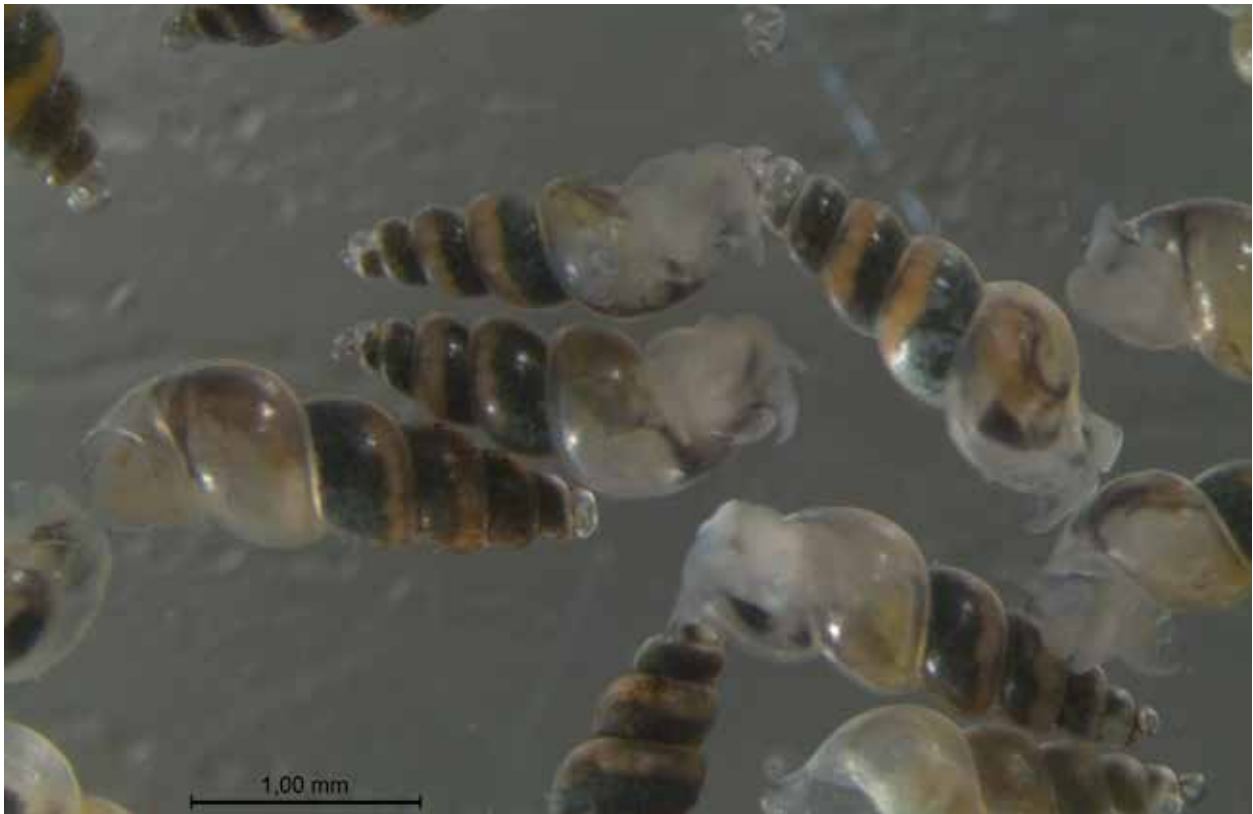
Fig. 1. De onbeschreven brakwaterslak ('Vreemde speldhoren') uit het Krammer-Volkerak.

miskembare soort binnen de Nederlandse fauna (fig. 2, 3). Uit omringende landen is echter een soort bekend die een duidelijke gelijkenis vertoont. Deze Fijngestreepte speldhoren Ebala nitidissima is in Nederland alleen bekend van enkele op het strand angespoelde huisjes (R.H. de Bruyne, persoonlijke mededeling). Het is denkbaar dat deze met zeegrasvelden geassocieerde soort een keer levend in Nederland opduikt.