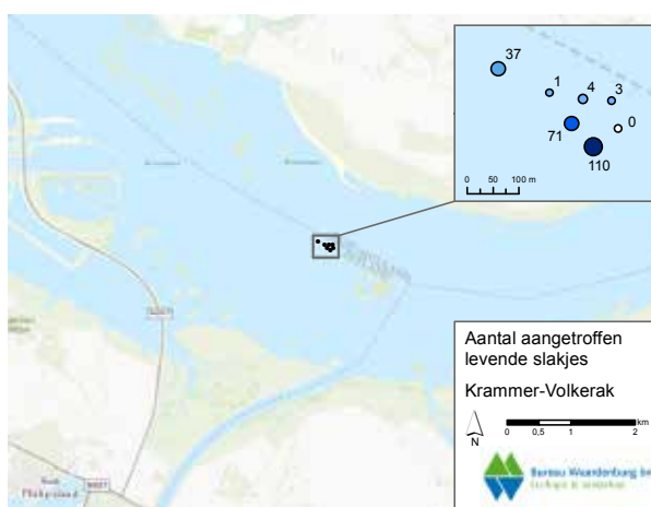
Fig. 5. Locaties van Murchisonella spec. ('Vreemde speldhoren') in het Krammer-Volkerak. Aangegeven is het aantal in 2016 verzamelde levende exemplaren per monsterlocatie.