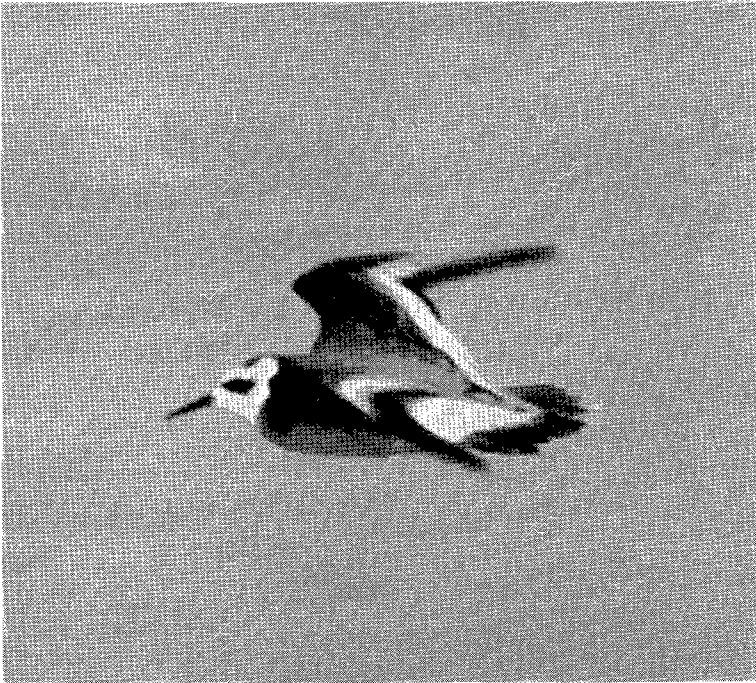
Fig. 1. Rosse Franjepoot, Phalaropus fulicaria , in de vlucht. Scheveningen-Haven, 31 okt. 1955.

1955: 18 jan., 1 ex., aldaar (TANIS); 30 okt., 2 ex., Scheveningen (Sw, Wa); 31 okt., 3 ex., aldaar (Ki, Ko, Te, Wa) (zie fig. 1 en 2); 2 nov., 1 ex., ibidem (KIST).