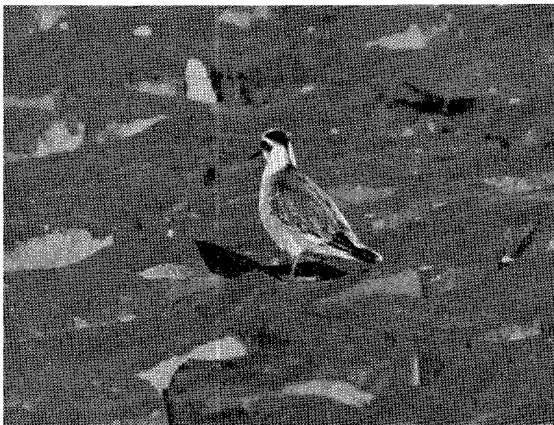
Fig. 2. Rosse Franjepoot, Phalaropus fulicaria . Scheveningen, 31 okt. 1955.