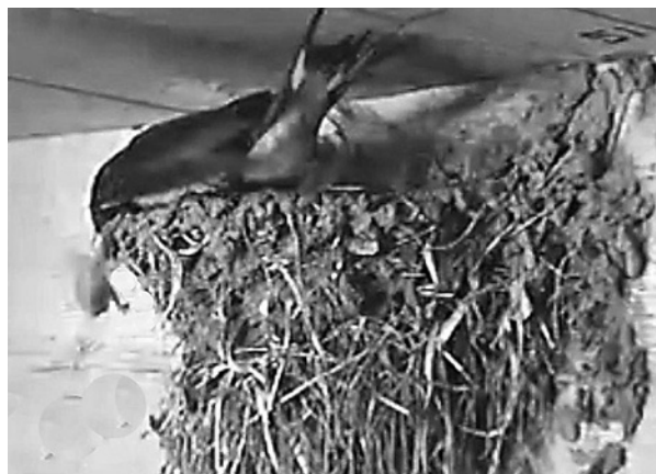
Figuur 2. Still van de webcamsbeelden waarop is te zien dat het boerenzwaluwmannetje op 17 juni om 10:23 uur een jong het nest uit gooit. Webcam still showing the Barn Swallow male ejecting a nestling from the nest on 17 June 2012 at 10:23.

Het voorkomen van infanticide, althans in Denemarken waar een populatie Boerenzwaluwen 25 jaar werd gevolgd, houdt gelijke tred met de jaarlijkse overlevingskans: bij hoge