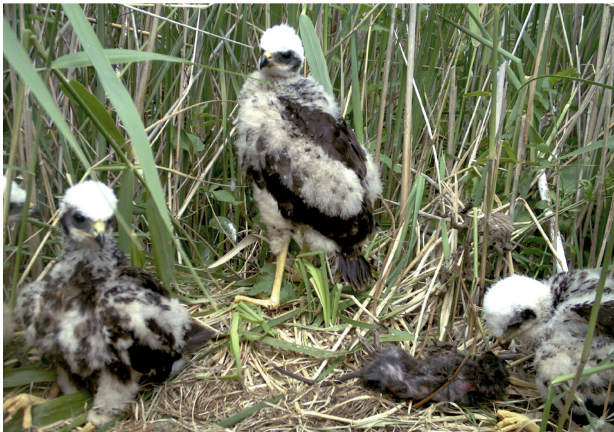
Jonge Bruine Kiekendieven op nest 1 met een Bruine Rat op 19 juni 2013. Marsh Harrier nestlings at nest 1 with a Brown Rat on June 19th 2013.

deze tijd 16 keer prooi aan waarbij ze op het nest landde. Daarnaast werd er 18 keer een prooi op het nest gedropt zonder dat een oudervogel zichtbaar was. De belangrijkste prooi-soort bij dit nest was de Spreeuw Sturnus vulgaris . Daarnaast werden Haas, Bruine rat, Meerkoet Fulica atra , muis Microtus sp. , Mol Talpa europaea , Graspieper Anthus pratensis , eend Anas sp. en Grutto Limosa limosa aangebracht (tabel 1). Ook hier betrof het jonge prooidieren, met uitzondering van de achterpoten van een adulte Haas.