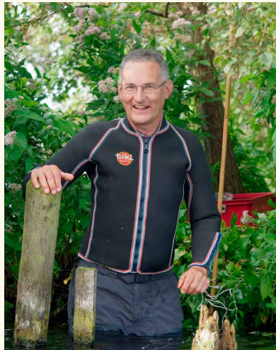
Krooneenden vangen in de Vinkeveense Plas-sen, augustus 2014.