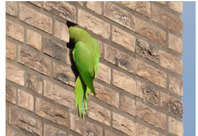
Halsbandparkiet tegen de muur van een school in het Genderpark, 25 augustus 2024 (FH).