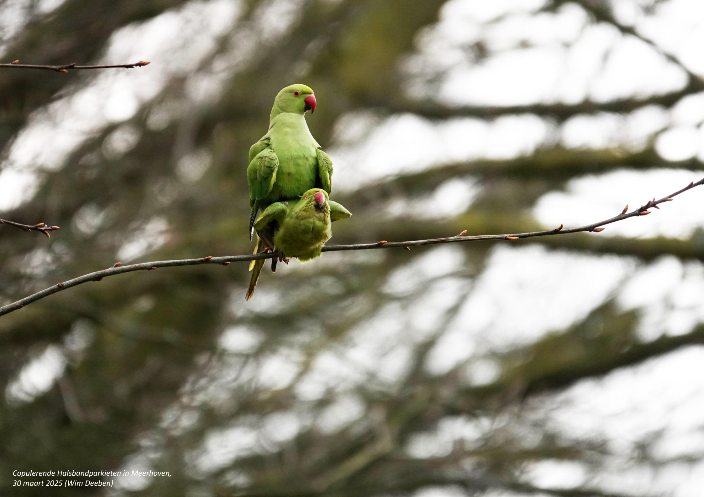
Copulerende Halsbandparkieten in Meerhoven, 30 maart 2025 (Wim Deeben)