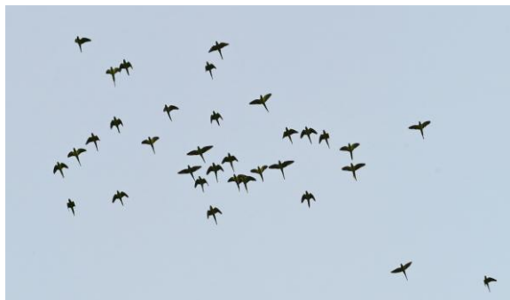
Grote groep Halsbandparkieten in woonwijk De Berkt in Veldhoven, 13 augustus 2014 (TH).

In Veldhoven Zoo bevinden zich momenteel ongeveer 100 Halsbandparkieten in kooien (mededeling Richard Loomans, Veldhoven Zoo) en dat trekt weer wilde Halsbandparkieten aan. Inwoners van Veldhoven denken bij het zien van Halsbandparkieten dan ook vaak aan ontsnapte exemplaren uit de dierentuin (voorheen Papegaaienpark). Bij de gemeente Veldhoven kwamen om die reden vaak meldingen binnen van Halsbandparkieten in tuinen op voedersilo's. Het betrof dan lokale broedvogels die vaak ook gezamenlijk sliepen in woonwijk De Berkt. Zo werden in De Berkt grotere groepen gezien op 11 augustus 2024 (30 ex, waarneming.nl ), 13 augustus (35 ex, waarneming.nl ) en 6 september 2024 (25 ex, waarneming.nl ).