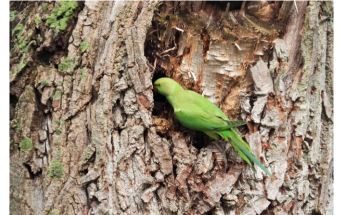
Halsbandparkiet in het Genderpark, 26 januari 2021 (FH).

ze gebruik van holtes in oude bomen, vaak spechtengaten in Canadese populieren.