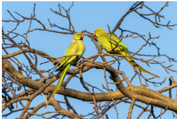
Halsbandparkieten in Landschapspark Meerland, 12 april 2021 (Rob Jansen).

Halsbandparkieten leken in de Kempen te zitten in een strook van Eindhoven richting wijk Meerhoven (Landschapspark Meerland) en Veldhoven, maar dat blijkt anno 2025 niet meer zo. Ook in Woensel-Noord en bij Nederwetten (Bokt) worden ze nu gezien ( waarneming.nl ). Op 28 november 2024 werden tijdens een voorverkenning van de landelijke slaapplaatstelling zelfs 14 vogels geteld in het Amandelpark (Sovon, med. Jip Louwe Kooijmans).