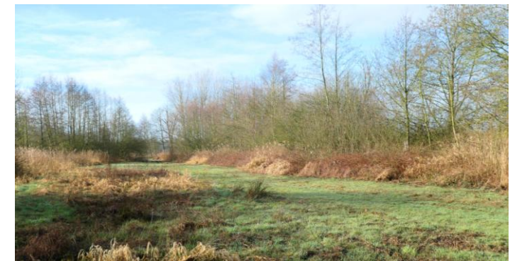
Rulse Laarzenpad, 25 februari 2025 (HH).

Dagelijk bezocht ik de omgeving van de kijkhut en dit leverde weer soorten op zoals Scholekster , een luid roepende overvliegende Regenwulp , enkele Gele Kwikken , Tapuiten en een paar keer een groepje Beflijsters die regelmatig aan het eind van de dag fouragerend werden gezien op het grasland bij de kijkhut. Toen ik eens laat in de middag nog eens mijn patch bezocht en vanaf het fietspad het Scheidingsven afkeek ontdekte ik een paartje Geoorde Futen . Later in het jaar zag ik hier een aantal keren een paar met pulli. Op 12 april zocht ik langs het Rulse Laarzenpad naar Rietzanger toen ineens een Cetti's Zanger vlakbij zijn kenmerkende zang liet horen. Dit was een nieuwe plek voor deze soort en ik heb zeker 3 weken de vogel hier gehoord en toen niets meer. Nieuwe steltlopers deze maand waren Groenpootruiter , Kemphaan en Bosruiter .