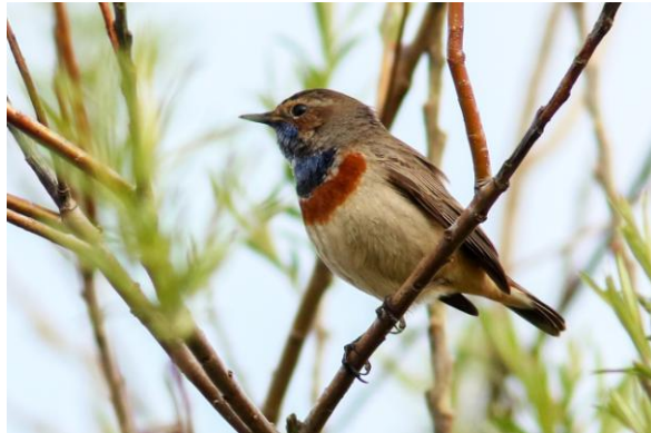
Blauwborst in de local patch, 9 april 2023 (HH).

Op 21 april hoorde ik eindelijk een zingende Rietzanger langs het Rulse Laarzenpad en noteerde ik zeker 3 zangposten van Blauwborst in het gebied grenzend aan het Rulse Laarzenpad.