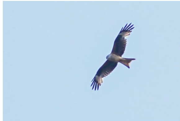
Rode Wouw over de local patch, 29 april 2025 (HH).