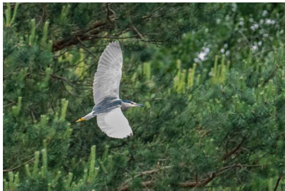
Kwak bij het Kiezelven, 23 mei 2025.