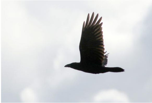
Raaf in de local patch, 27 augustus 2023 (HH).