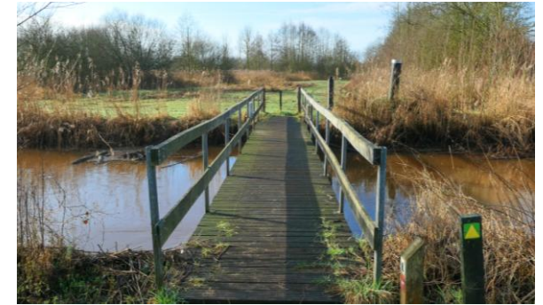
Rulse Laarzenpad met brug over de Kleine Dommel, 25 februari 2025 (HH).

Voor zover ik heb kunnen nagaan is er in 2024 geen enkele waarneming in mijn patch gedaan door andere vogelaars die voor mij nog nieuw zou zijn geweest in 2024.