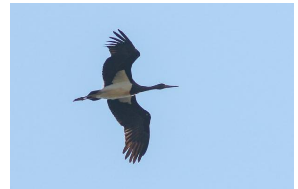
Zwarte Ooievaar over de local patch, 7 september 2023 (HH).