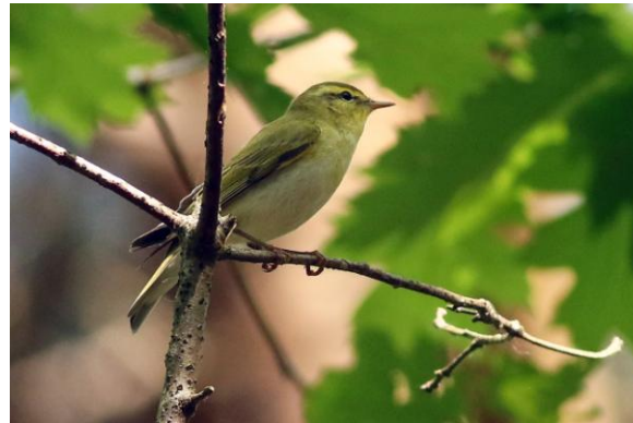
Fluiter in de local patch, 2 mei 2025 (HH).

Op 1 mei had ik een zingende Grauwe Vliegenvanger vlak voorbij het viaduct over de A67 waar mijn patch begint. Op 2 mei hoorde ik praktisch op dezelfde plek een Fluiter zingen die zich prachtig liet horen en fotograferen.