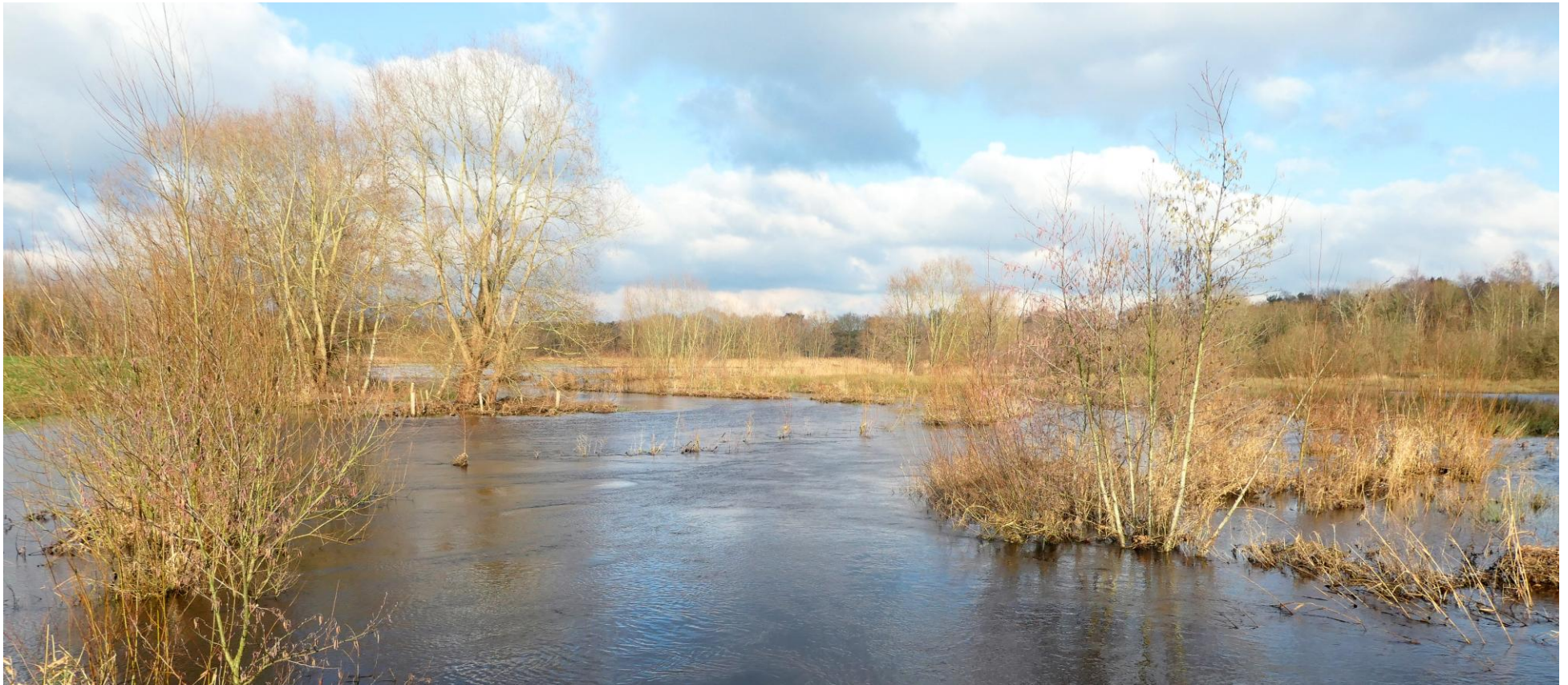
Overstromingsgebied in het Kleine Dommeldal, 8 januari 2024 (HH).

Ik vond het ook echt leuk om te doen. Je wordt gedwongen om te zoeken naar soorten die buiten je patch vaak veel makkelijker te vinden zijn maar juist in je patch behoorlijk moeilijk. Bijvoorbeeld toen ik eind april 4 overvliegende Knobbelzwanen had: yes! Dus je bent lekker aan het soortenjagen in je patch, krijgt tevens een goed idee van de broedvogelsoorten in je gebied en is het is goed voor je birding skills. En zelf ontdekken blijft toch het leukste.