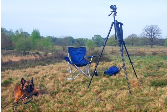
Trektelpost met bewaking, 13 april 2024 (HH).

Er werden al een tijdje enkele juveniele Roodpootvalken gezien in het gebied rond het Beuven. Op 7 september stond ik 's avonds vanaf het fietspad uit te kijken over het Scheidingsven toen ik een valk zag vliegen die mogelijk deze soort was, maar helaas te ver voor een definitieve determinatie en ik had ook geen scoop bij me. Ik had het eigenlijk al opgegeven toen de valk weer terugkwam en nu veel dichterbij langs vloog. Inderdaad een juv. Roodpootvalk .