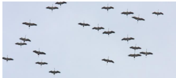
Kraanvogels, 2 april 2011 (HH).

Begin maart begon goed met prachtig een Klapekster vlak langs het fietspad; dat bleek de enige waarneming van 2024 te zijn. Op 4 maart struinde ik aan de rand van mijn patch wat veldjes af toen ik onverwachts een Patrijs hoorde roepen. Het geluid kwam uit een verwilderd hoekje van het veld en toen ik voorzichtig daar naar toe liep zag ik ineens een Patrijs door de scrub lopen. Een onverwachte en geweldig bevredigende waarneming aangezien het nou niet bepaald goed gaat met deze soort.