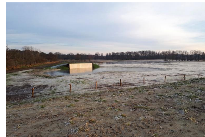
Achtereinds Laag in ontwikkeling, 22 december 2021 (TH).

Mari herinnert zich nog een ledenavond van de VWG waar hij uitleg gaf over de plannen van Brabants Landschap om in het Achtereinds Laag landbouwgrond om te vormen naar natuur. Hij denkt met een goed gevoel aan terug aan die bijeenkomst.