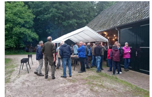
BBQ Brabants Landschap in het Kasteelbos bij Heeze, 20 juni 2015.