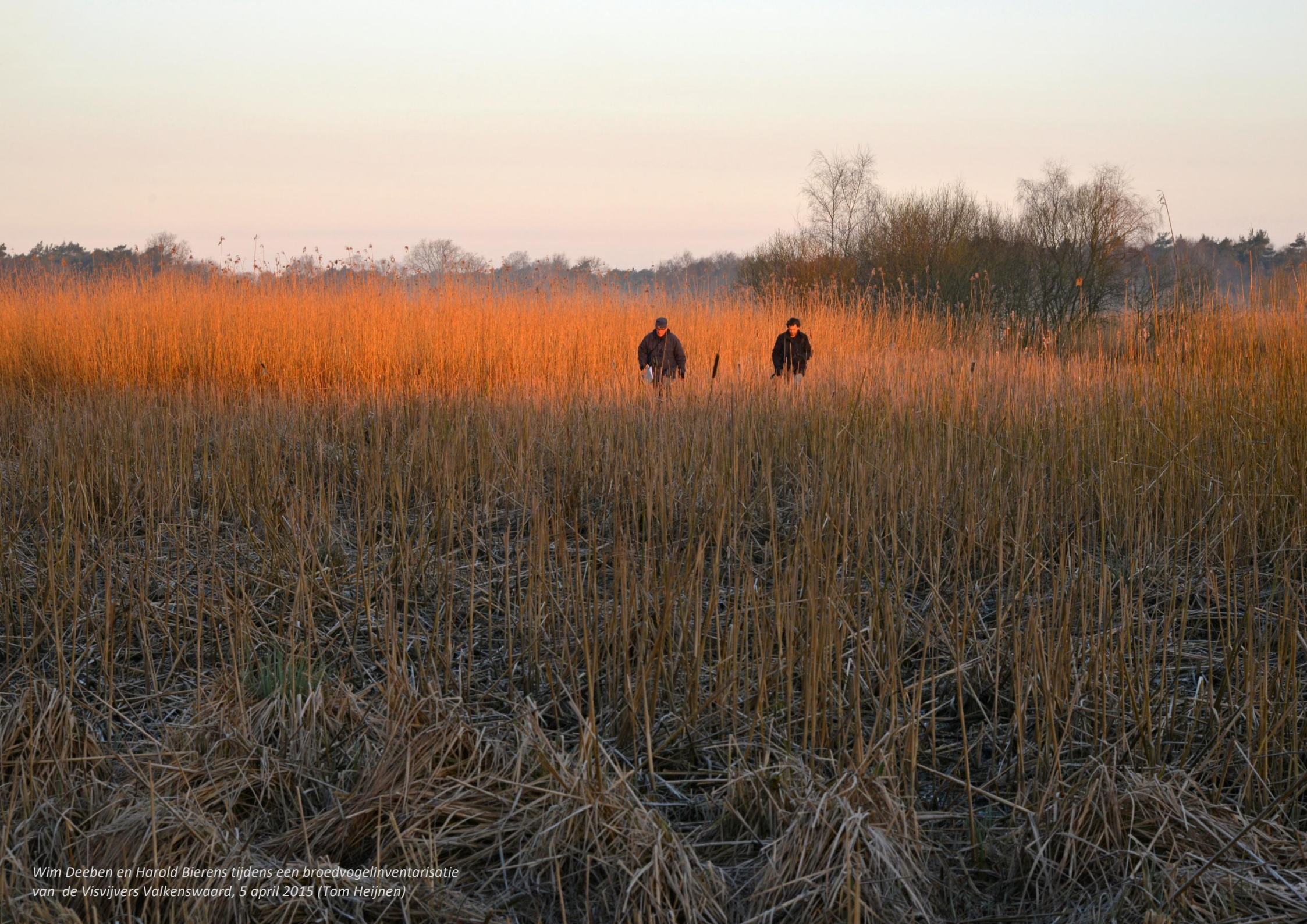
Wim Deeben en Harold Bierens tijdens een broedvogelinventarisatie van de Visvijvers Valkenswaard, 5 april 2015