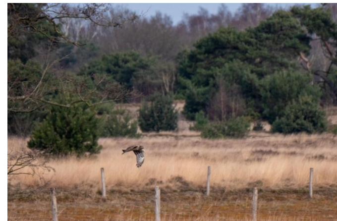
Ringtaart Blauwe Kiekendief op de Gastelse Heide, 12 maart 2022.

sneeuw en harde wind gaan posten. Het lijkt me heel interessant om dan de cijfers naast elkaar te leggen.