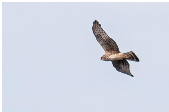
Ringstaart Blauwe Kiekendief op de Gastelse Heide, 12 maart 2022.

maken de gebruikers zelf de inhoud. Dus die termen hoeven niet te kloppen. Het moet een soort contactroep zijn geweest maar wat ze ermee wilden uitdrukken?