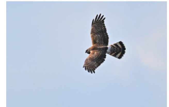
Ringstaart Blauwe Kiekendief bij Spekdonken, Vesseem, 29 maart 2025 (TH).

Om 17.12 uur kwamen 2 mannetjes ook uit OZO. Er zat ongeveer 30 meter verschil en ze vlogen ongeveer over het vrouwtje heen maar die gaf nog steeds geen reactie. Toch steeg ze kort daarna op en vloog erachteraan en landde kort daarna in de heide. Vervolgens heb ik haar niet meer gezien. De mannetjes vlogen iets langer rond maar zeker minder dan een minuut en waren ook weg.