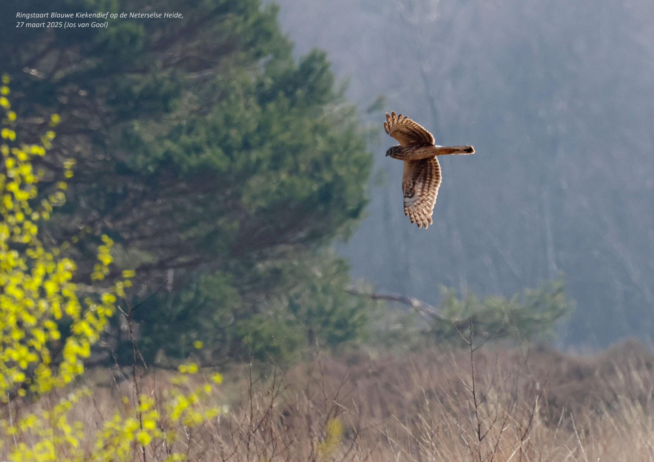
Ringstaart Blauwe Kiekendief op de Neterselse Heide, 27 maart 2025