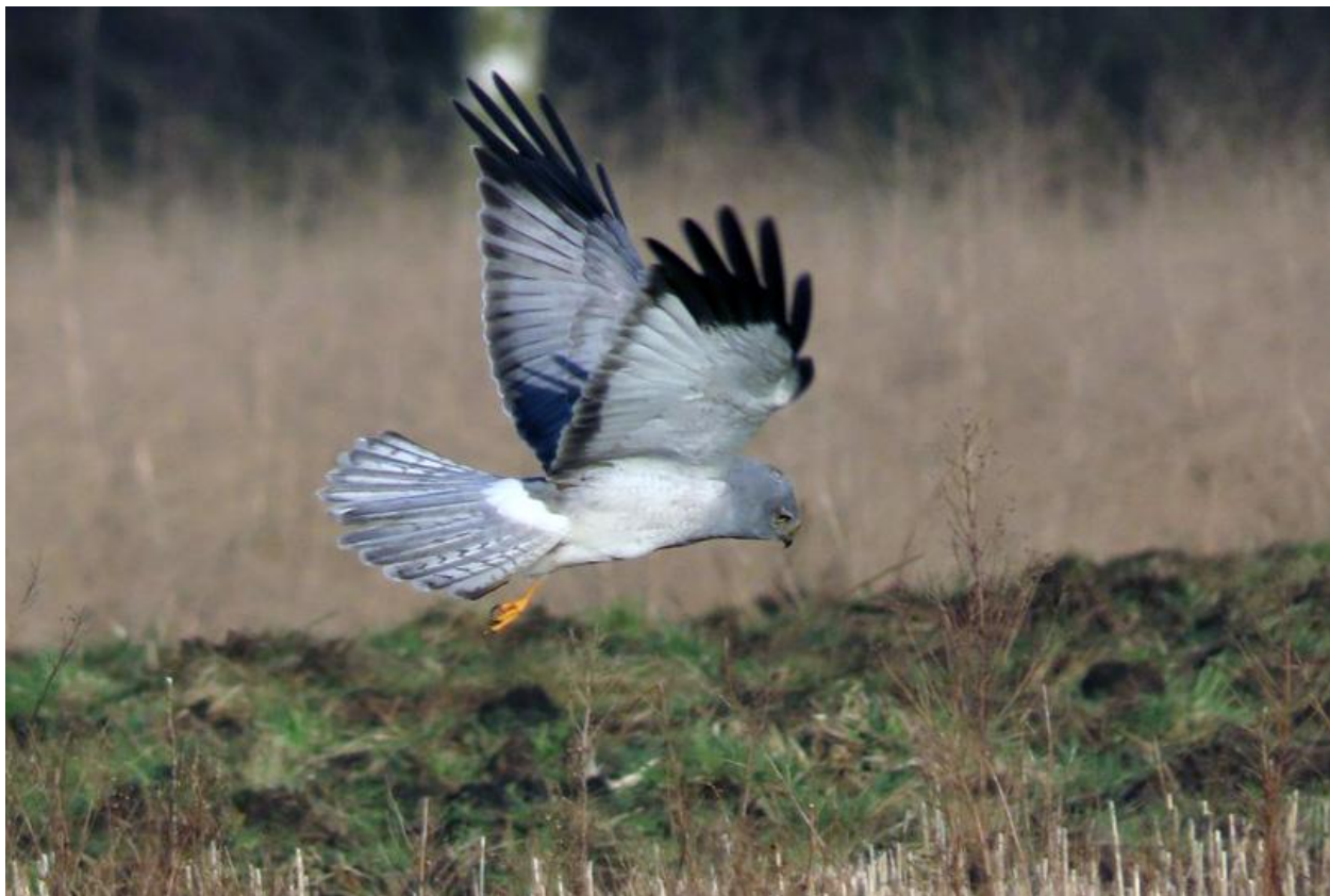
Man Blauwe Kiekendief op de Gastelse Heide, 2 februari 2025.

broedgevallen in Groningen van Blauwe Kiekendieven. Helaas veranderde de regeling na 1993 in een éénjarige braaklegging. De veldmuizenpopulatie stortte in en daarmee ook de kansen voor de Blauwe Kiekendief.