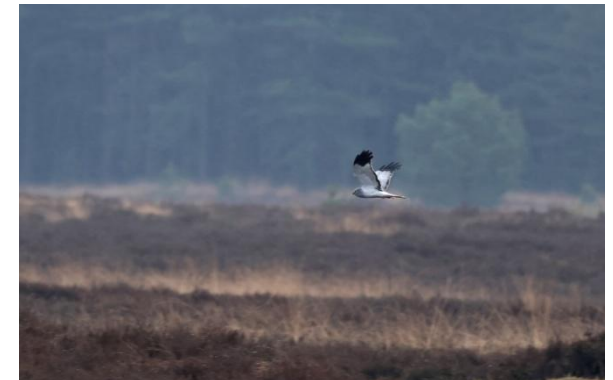
Man Blauwe Kiekendief boven de Groote Heide, 30 januari 2025 (Bjorn Alards).

Nog even in het kort, minimaal drie mannetjes, maximaal vijf mannetjes maar ik denk toch gewoon drie. En 1 vrouwtje/ringtail. Dus dan zou het gelijk zijn aan telling 1. En die telling 2, zou ik toch niet lang genoeg hebben gestaan? Want je zag wel, 20 minuten na zonsondergang kwamen ze nog binnen en het was ook zo weer voorbij.