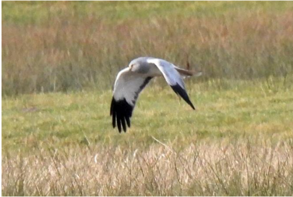
Man Blauwe Kiekendief bij het Beleven, 19 februari 2025 (Cor van Pelt).

De Buizerd is flexibel in zijn voedselkeuze dus de achteruitgang is wat minder duidelijk en misschien minder verbonden met de muizenachteruitgang. De Velduil gaat weliswaar vooruit maar in zulke lage aantallen zijn conclusies moeilijk te trekken.