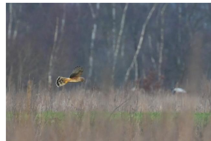
Ringstaart Blauwe Kiekendief op de Gastelse Heide, 27 januari 2024 (TH).

Bijzonderheden. Het vrouwtje leek een volwassen vogel. De onderkleur van de buik en borst leek meer wit/licht dan geelachtig-bruin. De ondervleugel had veel licht- en donker-contrasten. Bij goed zicht had ik de meer druppelvormige tekening op de borst moeten kunnen zien in plaats van de meer dun gestreepte tekening van jongere vogels. Maar helaas.