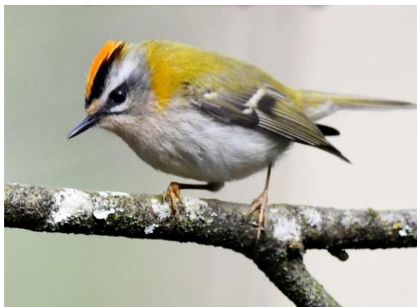
Vuurgoudhaan in De Baest, 10 april 2024.

In de maand februari heb ik gekeken en geluisterd bij Hedera opstanden van enige omvang tegen bomen groeiend. Vuurgoudhaan op niet al te grote afstand is voor mij hoorbaar met gehoorapparaten. In geen enkel geval was er een roepende Vuurgoudhaan hoorbaar of zichtbaar. Je hoort ze niet en je ziet ze niet, maar ze zijn er wel die kleine duvels, meestal hoog in de begroeiing verscholen tussen dicht Hedera gebladerte.