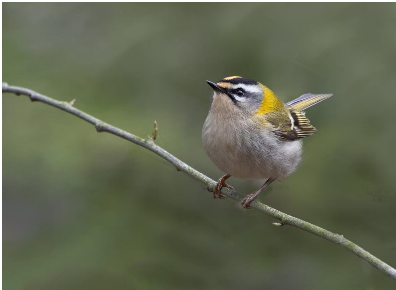
Vuurgoudhaan in Budel-Dorplein, 9 maart 2024 (Hennie Lammers).

Tot mijn grote ergernis is bij twee rijk met Hedera begroeide bomen de hoofdstam van de Hedera vermoedelijk door de Gemeente doorgezaagd. Net op die plek bevond zich een Vuurgoudhaan! Daar doe je het dus voor. Er wordt navraag gedaan naar de gang van zaken. Ik ken de smoes al: veiligheid.