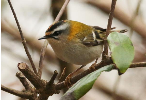
Vuurgoudhaan in Valkenswaard, 23 januari 2024 (Roel Verbraak).

Veel sparrenbos is verloren gegaan of gaat nog verloren door enerzijds droogte en ziekte en anderzijds overdadige nattigheid. In veel natuurgebieden op de zandgronden is en wordt veel naaldhout en dus ook spar vervangen door autochtoon loofhout.