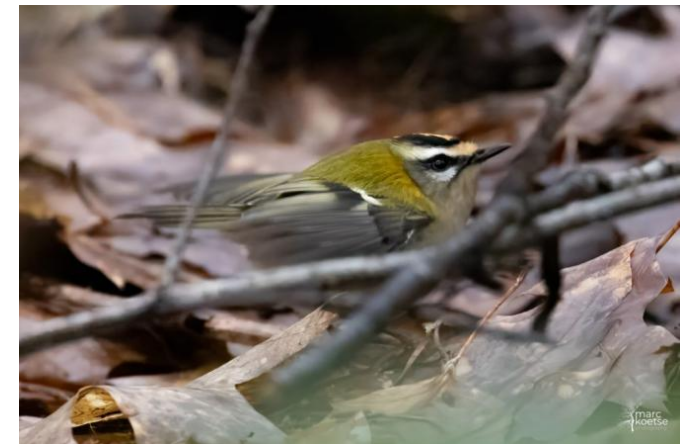
Vuurgoudhaan op de Heezerheide bij Aalst, 4 januari 2025 (Marc Koetse).

Volgens Sovon zijn in het oosten tijdens de winter Vuurgoudhaantjes in de broedgebieden 'met een lampje te vinden', terwijl in het westen, waar veel minder Vuurgoudhaantjes broeden, de aantallen veel ruimer zijn. Bekend is dat Vuurgoudhanen korte afstand trekkers zijn. Betekent dit dan dat de oostelijke populaties, dus ook die uit de Kempen, richting het westen vertrekken omdat daar mogelijk meer voedsel te vinden is, of omdat ze gewoon stoppen met de trek omdat ze niet anders kunnen gezien hun energiehuishouding en relatief grote voedselbehoefte? En zijn er ook Vuurgoudhanen te vinden uit midden Europese populaties? Of blijven die hier bijvoorbeeld in de Kempen hangen?