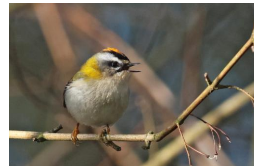
Vuurgoudhaan in Veldhoven, 2 februari 2025 (Ludy Aarts).