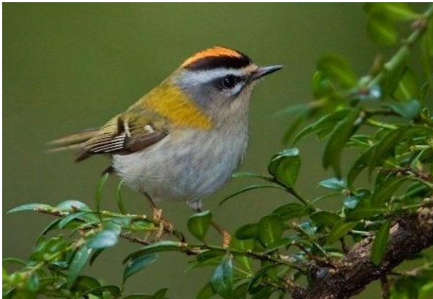
Vuurgoudhaan in de Heikant, Veldhoven, 2 februari 2025.

Dit artikel bevat een beschouwing uit de literatuur over de verspreiding van de Vuurgoudhaan, aangevuld met een klein eigen onderzoek dat zich richt op de vraag: waar bevinden de Vuurgoudhanen zich in de Kempen in de winter?