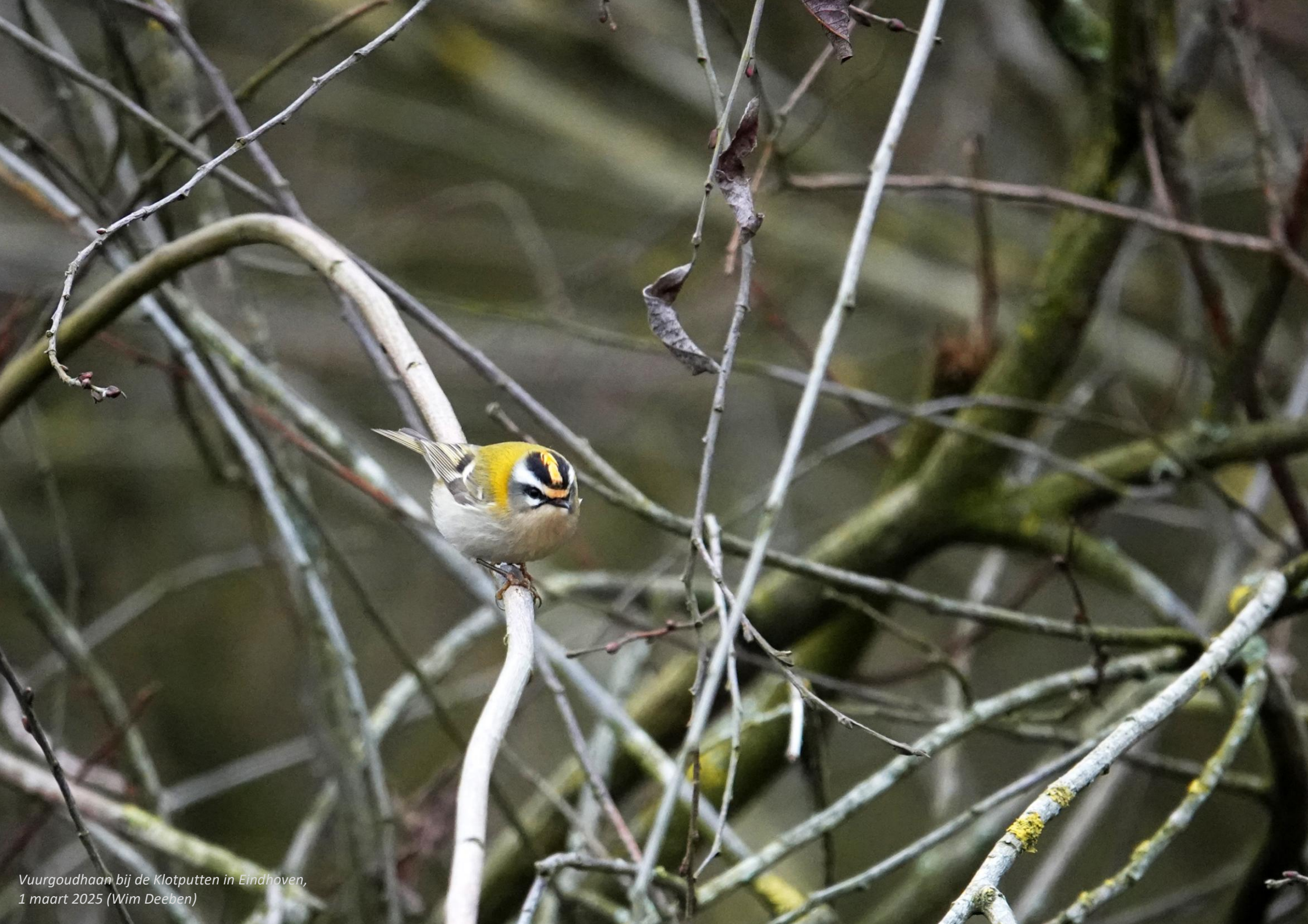
Vurgoudhaan bij de Klotputten in Eindhoven, 1 maart 2025 (Wim Deeben)