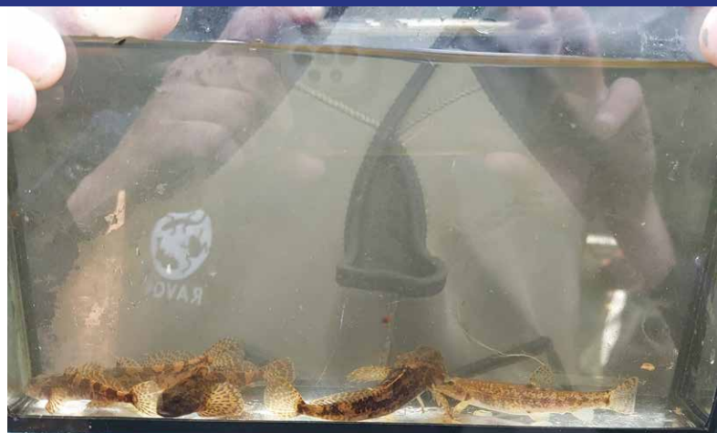
Er werden heel veel rivierdonderpadden gevangen.