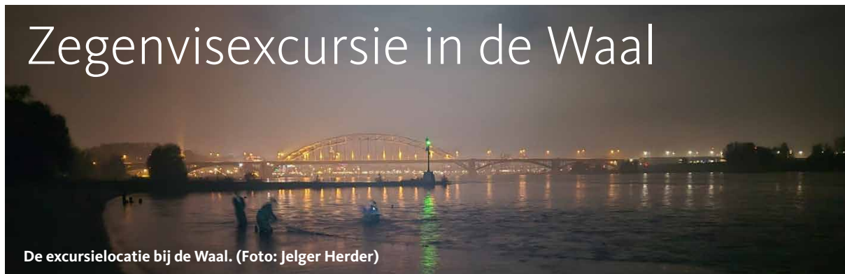
De excursielocatie bij de Waal.

Op 18 oktober 2024 was de laatste visexcursie van het seizoen. 's Avonds verzamelden de deelnemers bij de Waal bij Nijmegen waar met behulp van een zegenvis werd gevangen en gedetermineerd. Het was een gezellige en succesvolle avond met enkele bijzondere waarnemingen. De serpeling sprong er dit keer uit als meest opvallende soort (vorig jaar vingen we deze soort slechts één keer in zes excursies (Meinerswijk). Dit jaar hebben we ruim twee keer zoveel vissen gevangen als vorig jaar, voornamelijk door de grote aantallen juveniele grondels (Kaukasische dwerg-, Pontische stroom- en zwartbekgrondels). Ook het aantal soorten lag dit jaar hoger, met 16 soorten in plaats van 11 vorig jaar (zie afbeelding). Deze locatie blijft een topstek voor blauwneuzen, met opnieuw meer dan 20 exemplaren. Wat verder opviel was het hoge aantal Kaukasische dwerggrondels, die we vorig jaar niet hebben gevangen, maar dit jaar in overvloed aanwezig waren.