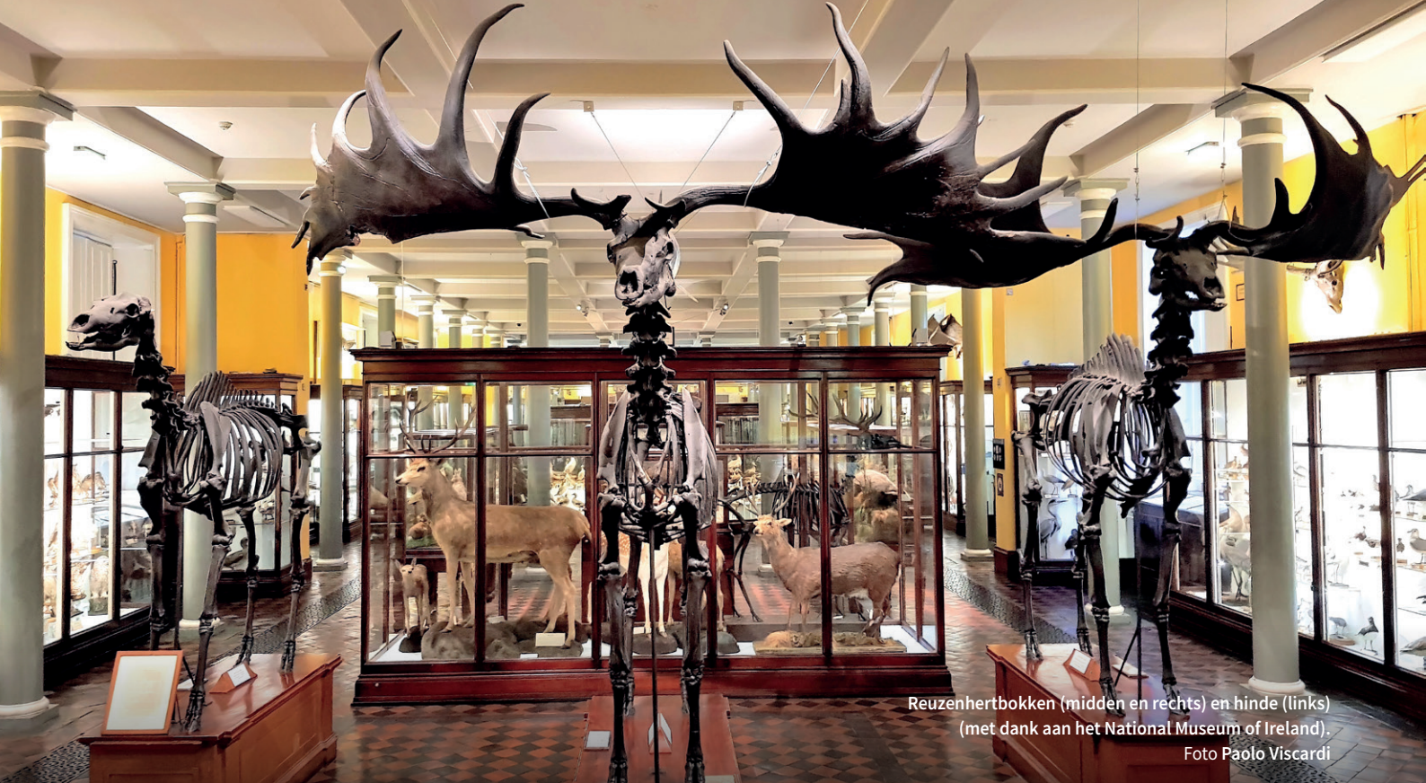
Reuzenhertbokken (midden en rechts) en hinde (links).