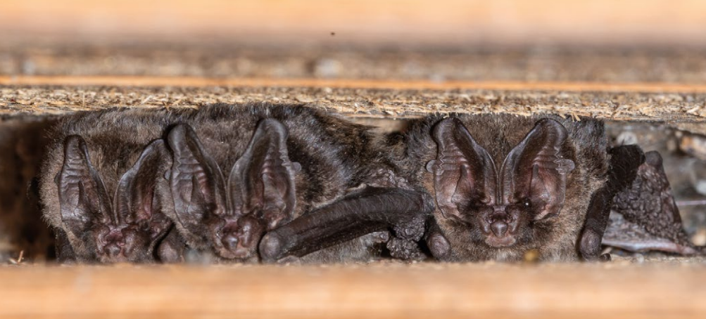
◀ Enkele mopsvleermuizen in een vleermuiskast in Duitsland op ongeveer 15 kilometer van Winterswijk.

als verblijfplaats dienen. Ze begeven zich meestal achter luiken, die wel iets weg hebben van loshangende schors. Mannetjes verblijven vaak solitair, terwijl de vrouwtjes in de zomer kraamgroepen van enkele tot tientallen dieren vormen. 3 De dieren wisselen vaak dagelijks van verblijfplaats, maar kraamgroepen van zogende vrouwtjes doen dit minder frequent. 4 Een hoog aanbod van dit soort plekken op een relatief kleine oppervlakte is dus een belangrijke vereiste van het leefgebied. Mopsvleermuizen jagen namelijk relatief dicht in de buurt van hun kraamverblijfplaatsen. 5