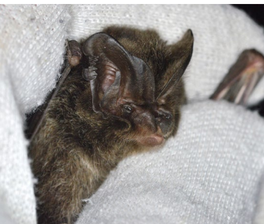
▲ De aangetroffen mopsvleermuis nabij Winterswijk.

Tijdens de winter gebruikt de mopsvleermuis eveneens bomen voor zijn winterslaap. Typisch voor deze soort is de hoge koudetolerantie. Vanwege de prooivoorkomst voor nachtvlinders, 1 die in de winter relatief veel aanwezig zijn vergeleken met andere vliegende insecten, kan de mopsvleermuis ook in de winter jagen. 6 Tijdens koudere periodes zoekt de mopsvleermuis meer beschutte, ondergrondse verblijven op om te overwinteren, zoals forten, kelders en mergelgroeven. Opvallend vaak overwinteren ze dan in de buurt van uitgangen, dikwijls de koudste plekken. 3 Zelfs als hier de temperatuur korte tijd onder het vriespunt komt, vindt de mopsvleermuis het geschikt voor zijn winterslaap.