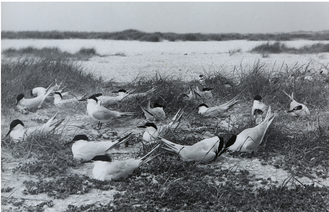
juni 1948 : De Grote stern was een van de icoon broedvogelsoorten van De Beer.