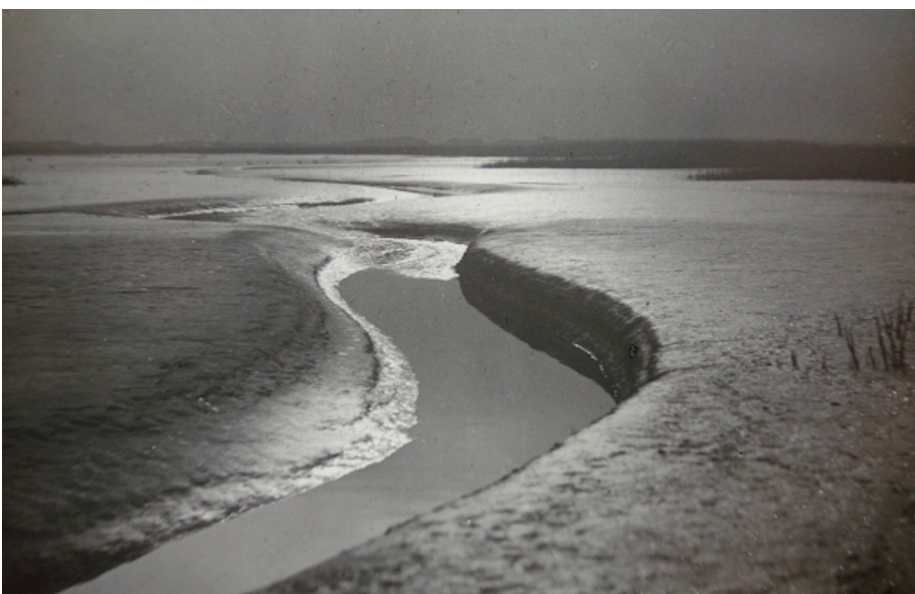
Beer Zuidslak, ca. 1930.

Over de apotheose die Rik had bedacht bewaarde hij de hele dag het zwijgen. Dat was maar goed ook want ik begon aardig moe te worden, hetgeen Rik niet ontging. In vallend schemer dirigeerde hij de minikaravaan voertuigen naar de Hartelhaven hoek Hartelkanaal, een locatie die vol zicht bood op de enorme kolenoverslagkade aan de Mississippihaven. Daar zette de filmploeg een enorm scherm op, waar de stevig waaierende wind algauw vat op kreeg. Om hun constructie te stutten sleepten de heren van alle kanten stenen aan; met succes. Ik kreeg het verzoek voor het scherm plaats te nemen waarna Rik via eveneens meegenomen apparatuur fragmenten uit de De Waard films op het scherm projecteerde. Met op de achtergrond de ook op een zondagavond in vol bedrijf zijnde Maasvlakte, met overal verlichting en rumoer, zat ik te kijken naar de Beer landschappen van driekwarteeuw geleden met kemphanen