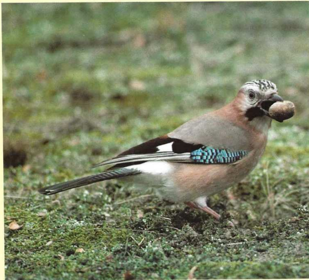
Rechts: Derde prijs fotowedstrijd In de herfst verzamelt de Vlaamse gaai eikels voor zijn wintervoorraad.