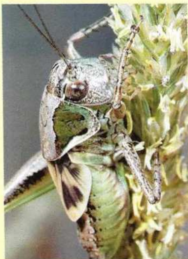
Geheel boven: Je ziet hem zelden, maar met zijn luide zang verraaft de Nachtegaal in welk struweel hij verstopt zit.