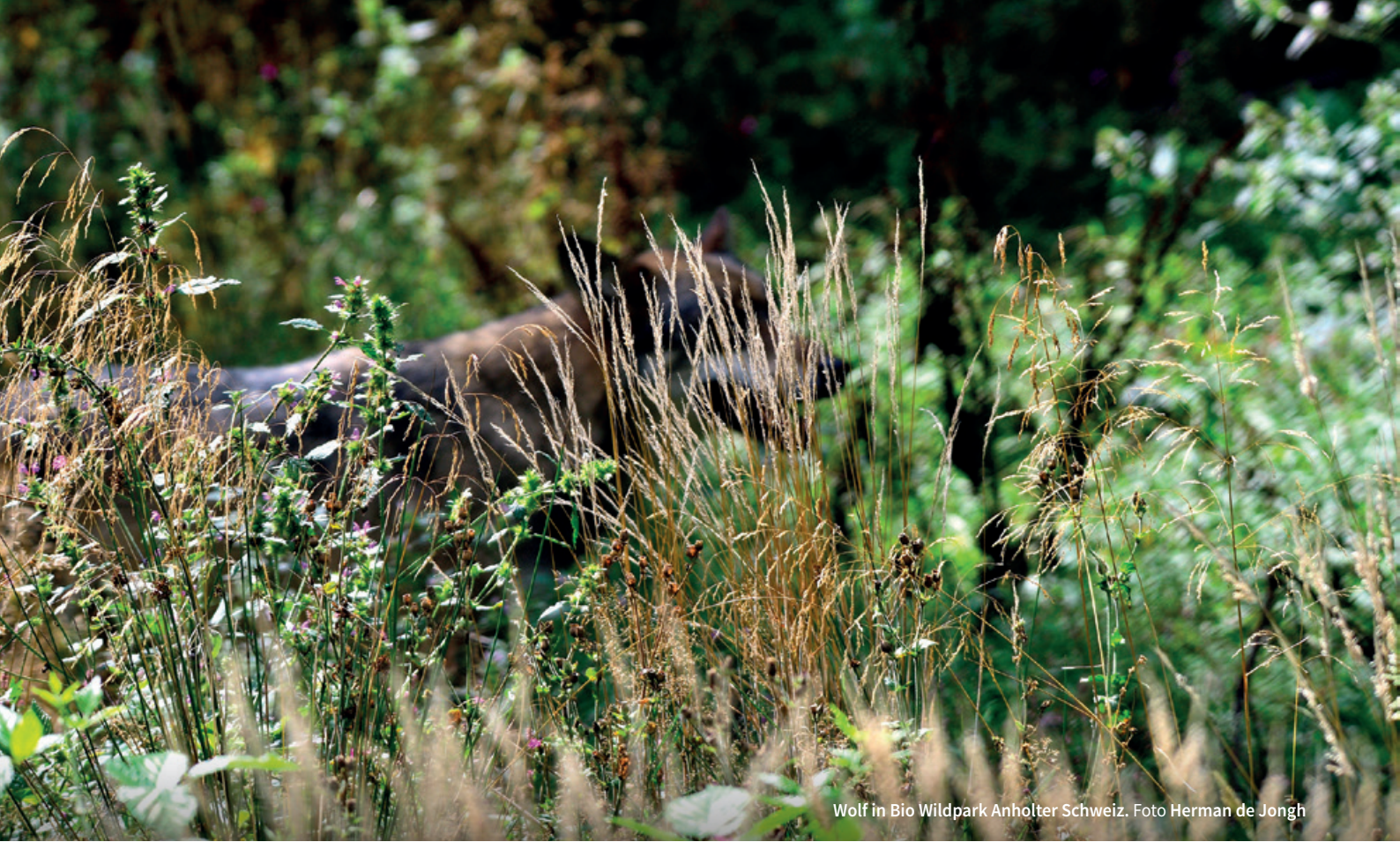
Wolf in Bio Wildpark Anholter Schweiz.

DE MYTHISCHE RELATIE VAN ONZE VOOROUDERS MET DE WOLF