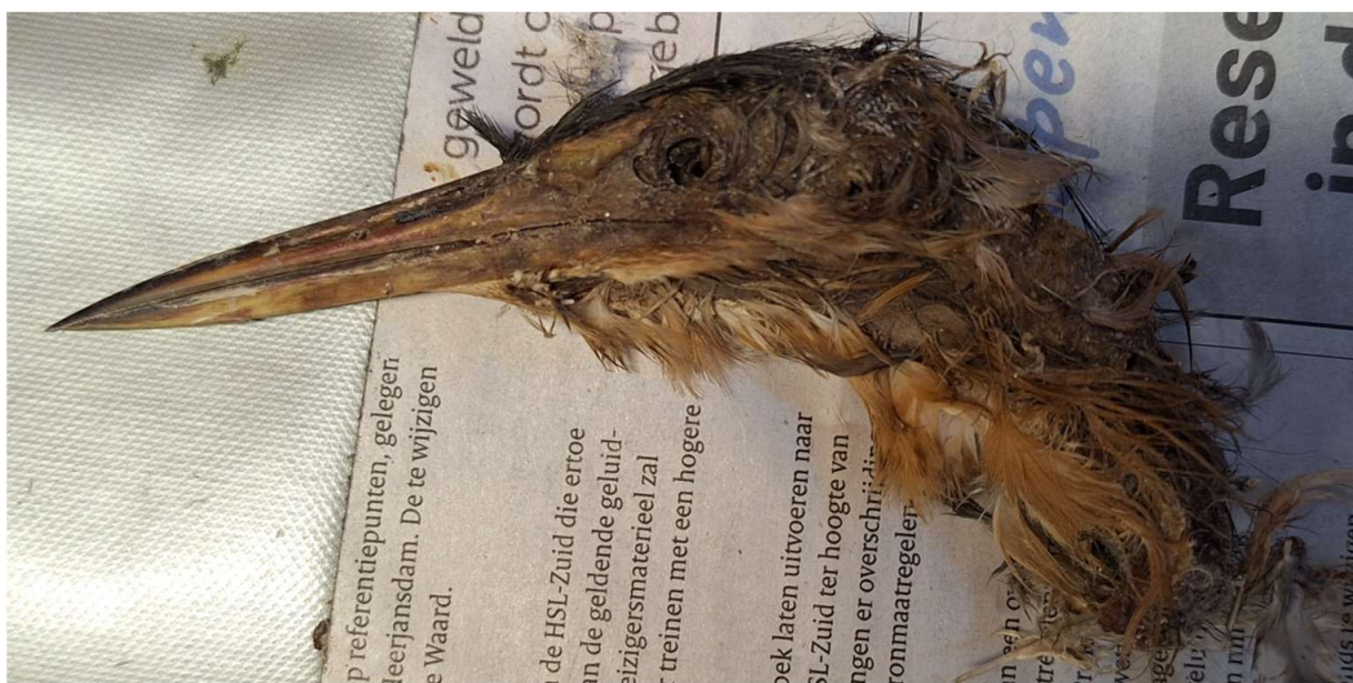
Een Woudaap was een nieuwe prooisort voor ons...

Tijdens de bezoeken aan de nestkasten verzamelen we zoveel mogelijk prooiresten om ze later te determineren. Inmiddels hebben we meer dan 80 soorten voorbij zien komen. Een enkele keer zelfs een kaalgevreten karkas van een Slechtvalk, kannibalisme dus. Deze waren we echter nog niet eerder tegengekomen: