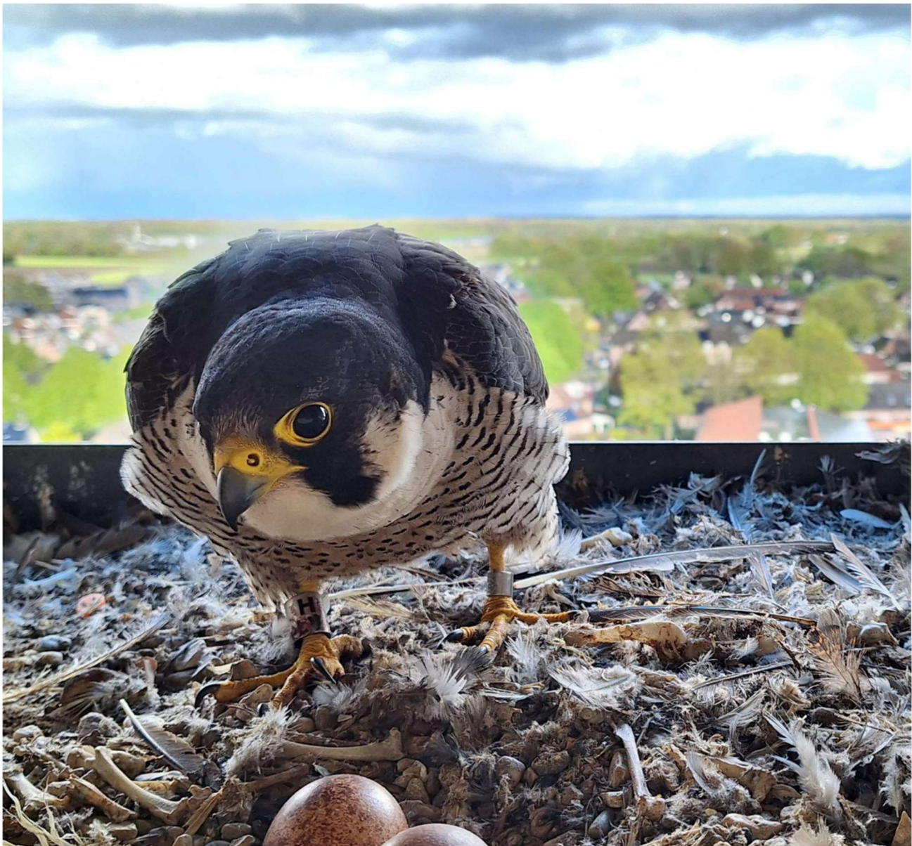
Het blijft leuk: foto's vanaf de achterkant van de nestkast. Het mannetje van Alphen NB kruipt weer op de eieren.