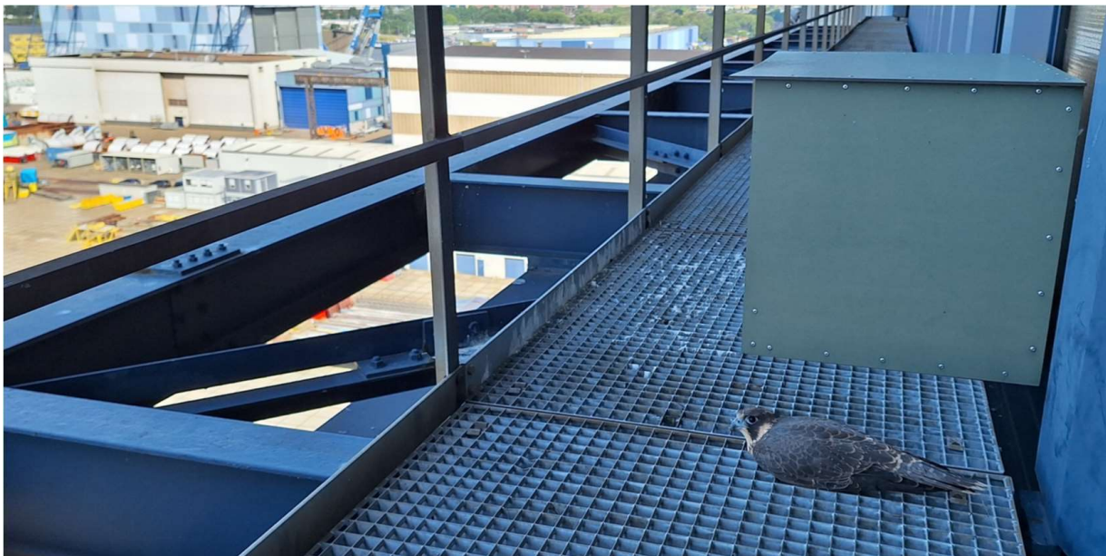
Eén van de 3 jongen van IHC Krimpen aan den IJssel: terug naar huis

Dit jaar waren er opvallend weinig jongen die vanuit de vogelasies terug moesten worden gebracht naar het ouderlijk huis. Hier één van de patiënten: