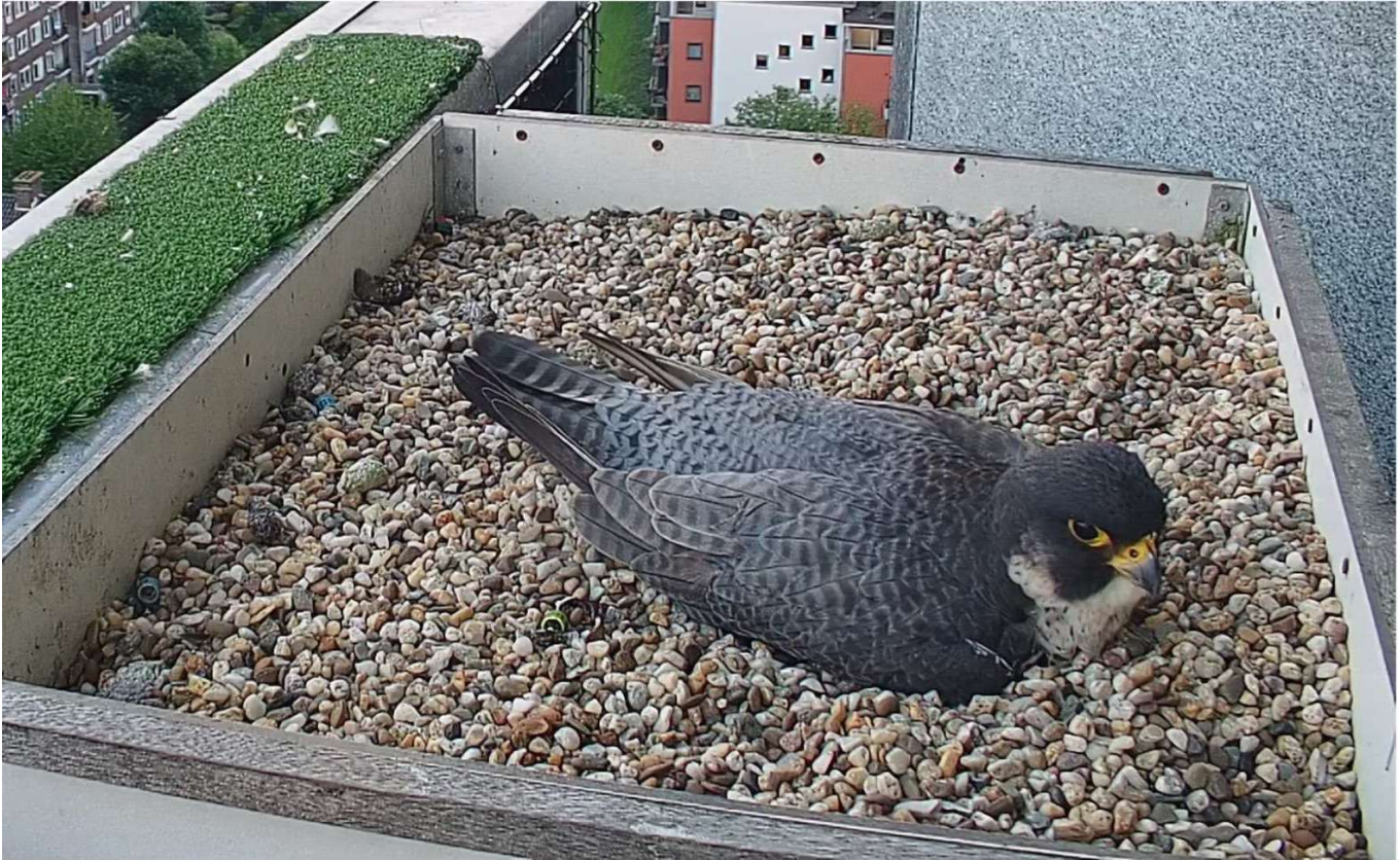
De valken in Rijswijk waren lang en plichtsgetrouw aan het broeden, maar er lagen nooit eieren.

Rijswijk was daar wel het meest sprekende voorbeeld van: op de camerabeelden was te zien hoe beide valken bijna continu aan het broeden waren, maar behalve de broedende valk lag er helemaal niets in het kuiltje.