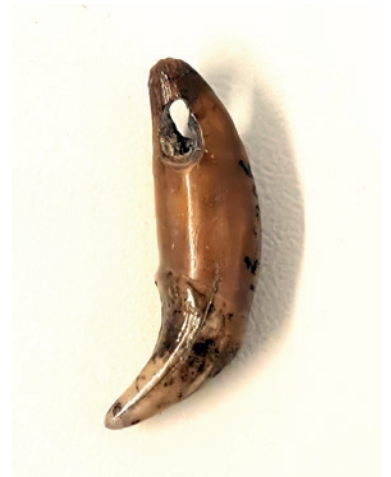
▲ Doorboorde hoektand van een otter uit de neolithische vindplaats Hekelingen. De doorboring is gemaakt door de wortel van de tand. Collectie Rijksmuseum van Oudheden, Leiden (inventarisnummer h 1980/7.16G-295).