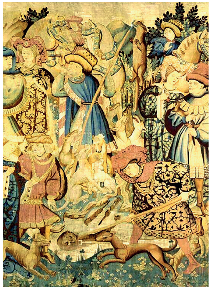
▼ Otterjacht in de Middeleeuwen, zoals verbeeld op de Devonshire Hunting Tapestries (1430-1450). Opvallend detail is de heer rechts, die een jonge otter op de arm heeft, mogelijk met de bedoeling om het dier te temmen en af te richten als hulpje bij de visvangst. Collectie Victoria & Albert Museum, Londen.