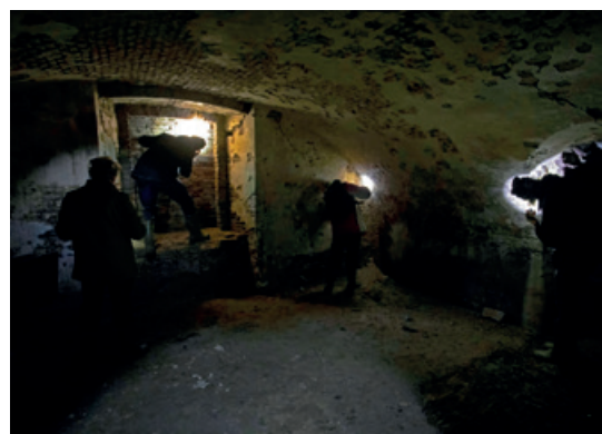
▲ Telgroep in actie in bunker.