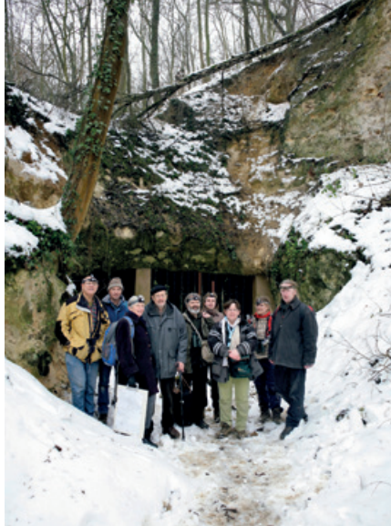
▲ Telgroep voor de groeve.

Het tweede artikel in dit speciale Lutra -nummer bevat een plattegrond met een overzicht waar in Nederland winterverblijven worden geteld. Ook laat het zien hoe het aantal getelde winterverblijfplaatsen in Nederland per provincie zich ontwikkelt. Dit belangrijkste artikel in deze Lutra geeft een overzicht van trends van de vleermuissoorten die in de winter in Nederland geteld worden. In acht hier opvolgende artikelen worden de resultaten van tellingen beschreven in mergelgroeven in Nederland en Vlaanderen, in forten van de