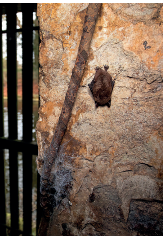
▲ Vleermuis in Kasteel Amerongen.

Een artikel over een onderzoeksmethode is zeldzaam in Lutra , maar in dit speciale nummer wordt beschreven hoe zogenaamde massawinterverblijfplaatsen van de gewone dwergvleermuis in stedelijk gebied gelokaliseerd kunnen worden. Bij de wintertellingen in groeven, forten en bunkers ontbreekt deze soort meestal, maar sinds de laatste eeuwwisseling worden er op steeds meer plaatsen winterverblijfplaatsen van de gewone dwergvleermuis gevonden, meestal in hoogbouw. Een bron van zorg is dat lekkende warmte waarschijnlijk belangrijk is voor deze functie en