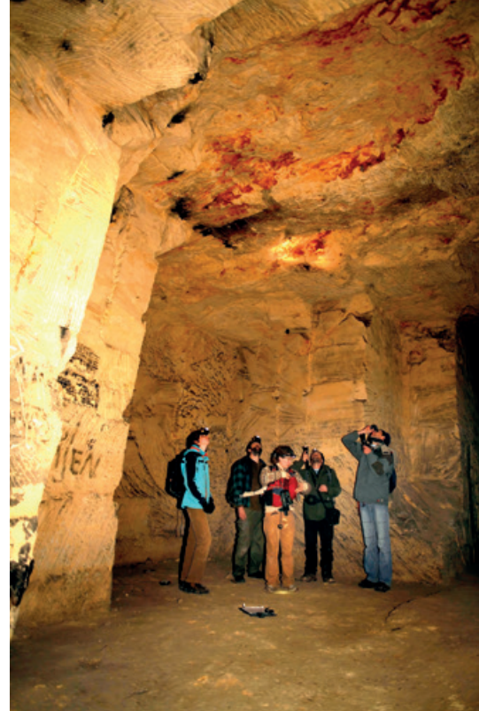
▲ Telgroep in de Schenkgroeve.

Wat de oorzaken waren van de achteruitgang in de tweede helft van de vorige eeuw weten we niet, en evenmin weten we waarom we nu een toename zien. Ook al hebben we nu veel meer informatie en veel meer middelen om vleermuizen te bestuderen, over de oorzaken van gesignaleerde trends tasten we nog grotendeels in het duister. Bovendien worden in de winter niet alle vleermuissoorten geteld. Soorten als laatvlieger en rosse vleermuis, die beide op de Rode lijst staan, overwinteren op plaatsen waar de dieren niet zicht- en telbaar zijn. Met methoden als vleerMUS (zie het artikel op pagina 26) wordt eraan gewerkt die kennisleemte te vullen.