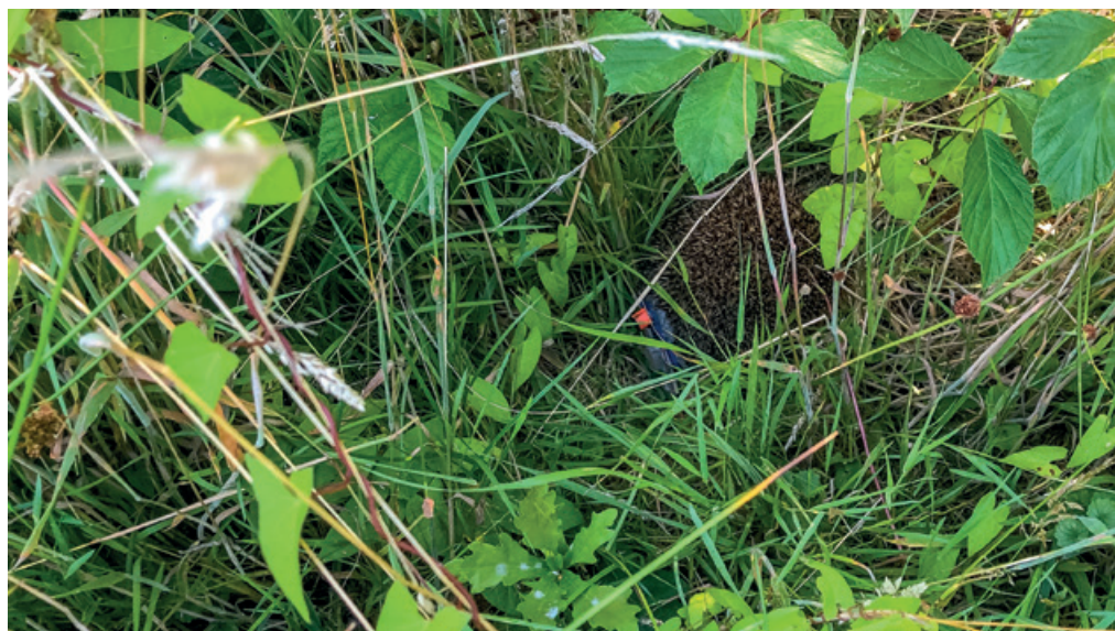
► (boven) Verblijfplaats 02-V-GA.