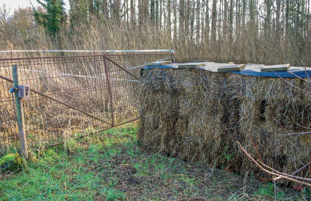
▲ Opstelling van een marterbunker met cameraval gericht op de toegangsoening.