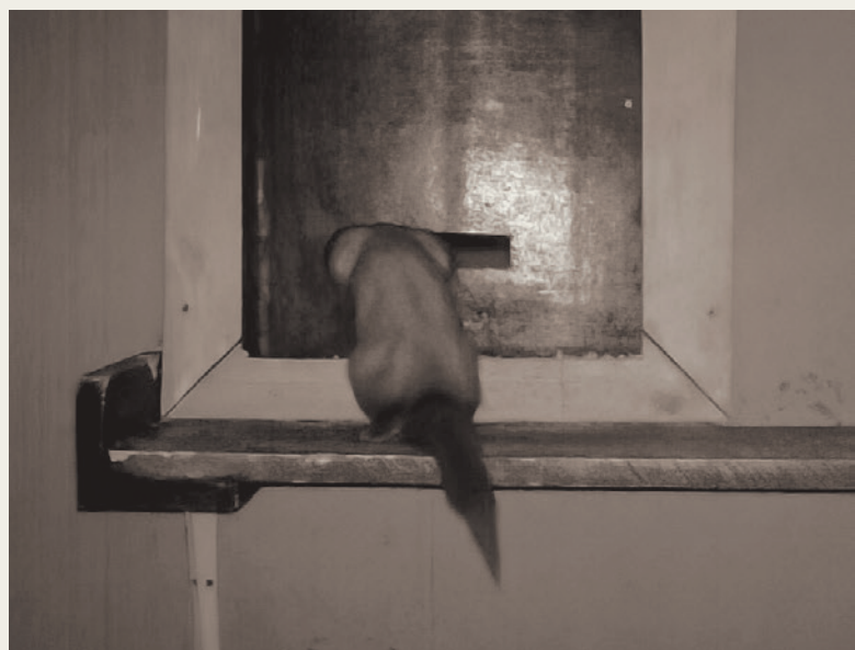
▲ Een volwassen steenmarterwijfje doet verwoede maar vruchteloze pogingen om doorheen een opening met diameter 5 cm te kruipen.