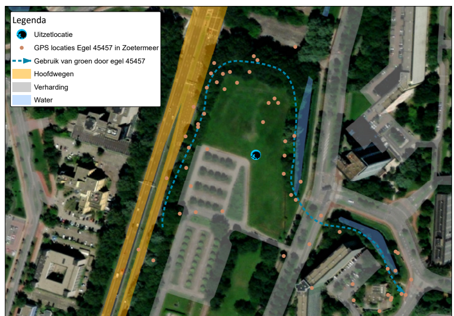
▲ Egel 45457 laat de voorkeur voor dekking in het landschap zien.