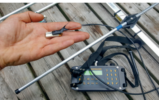
▲ De zender met op de achtergrond de ontvanger en handantenne.

De egels toonden een duidelijke voorkeur voor struweel; lage, dichte begroeiing. Openbaar groen en tuinen werden veel gebruikt om overdag in te slapen en 's nachts in rond te lopen. Daarbij is het aaneengesloten netwerk van tuinen een belangrijke verbinding om van het ene groengebied naar het andere te komen.