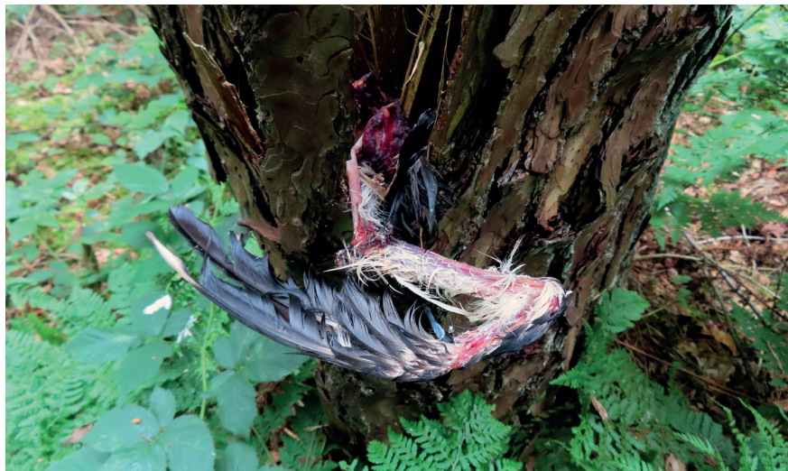
Foto 5. Oehoeprooi, een Kievit, vastgeklemd tussen schorsplaten van een grove den, 3 juni 2023. Lapwing as prey of Eagle Owl.

Driemaal werd op de plukplaats een dode – ogenschijnlijk onbeschadigde – opgerolde egel gevonden. Kennelijk worden ze dus ook als ‘bal’ getransporteerd. Bij een volgend bezoek werden dan doorgaans alleen nog de huiden aangetroffen.