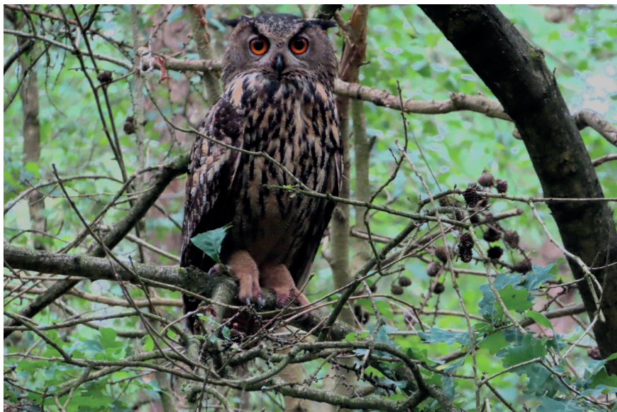
Foto 1. Alerte volwassen Oehoe nabij nest, zuidwestelijk Noord-Brabant, 27 juni 2023. Adult Eagle Owl on the alert near nest.

De bezoeken vonden doorgaans 's ochtends (na zonsopgang) en 's middags plaats. In de avond- en ochtendschemering, waarin de uilen al (of nog) actief zijn, is de locatie niet bezocht. Dit om ze niet onnodig te storen bij hun activiteiten. De oudervogels trokken zich ogenschijnlijk weinig aan van mijn wekelijkse bezoeken. Het vrouwtje bleef rustig op het nest zitten en de roestende man bleek evenmin bijster onder de indruk te zijn van mijn aanwezigheid, zelfs niet toen ik onder de roestboom stond.