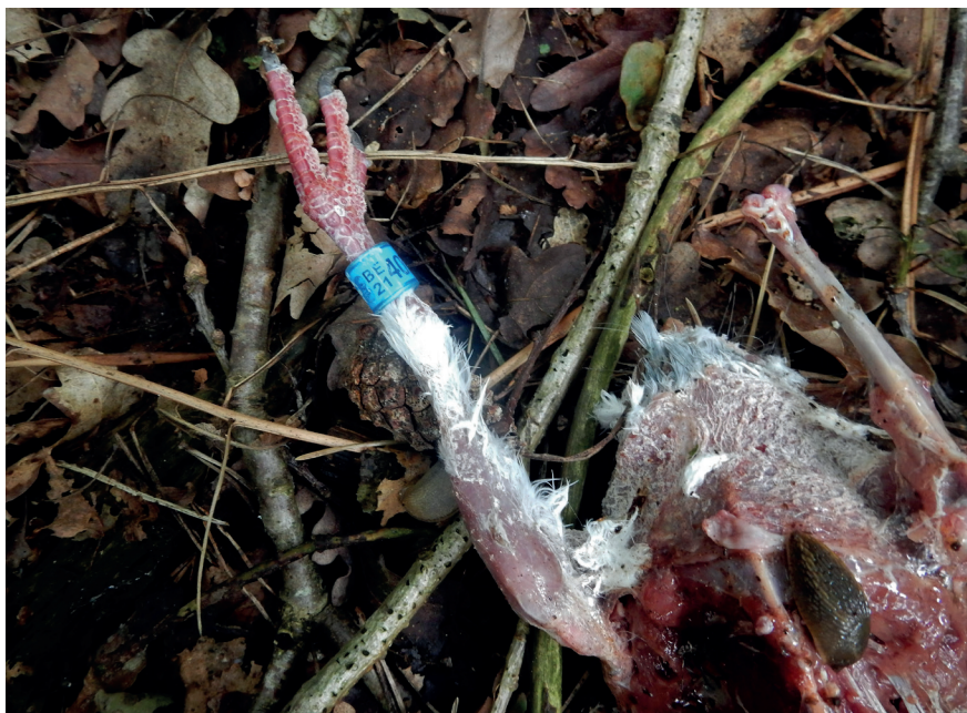
Foto 4. Belgische postduif als prooi van Havik in zuidwestelijk Noord-Brabant, 23 juni 2021. Belgian racing pigeon as prey of Goshawk.

Haviken hun prooien, vooral in grote bosgebieden met veel dekking, vaak al op de vangplaats plukken (zie ook Rutz 2003), worden in de nestomgeving vaker vraatresten (schouder- en bekkengordels, losse opperarmbenen, postduifringen) dan plukresten aangetroffen. Dit wordt ondersteund door de bevindingen van Rosendaal (1990) die op één nestlocatie 54 postduivenringen aantrof, maar slechts 16 plukresten in de wijde nestomgeving. In de tijd dat het vrouwtje aan het nest gebonden is, worden de meeste resten aangetroffen onder grote, vanaf het nest zichtbare en goed aanvliegbare bomen met forse zijtakken. Als de jongen niet meer bebroed hoeven te worden, begon het aantal resten onder het nest toe te nemen, maar in mindere mate dan bij de Oehoes het geval was. Na uitvliegen van de jongen lagen de resten meer verspreid in het nestbos. Hoewel sommige bomen of liggende boomstammen favoriet leken om te eten en/of te plukken, was er niet direct sprake van een vaste plukplaats. Door de dichte ondergroei van Varen Dryopteridacea , Bosbes Vaccinium myrtillus en Braam Rubus sp. zal op deze locatie zeker een deel van de resten gemist zijn.