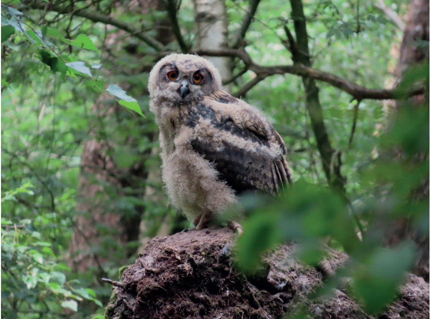
Foto 3. Pas uitgevlogen jonge Oehoe op de grond nabij nest, 27 juni 2023. Recently fledged Eagle Owl on the ground near nest.

niet veel meer over dan een platgewalste koek van prooiresten en uitwerpselen. Tot eind augustus waren de jongen meestal te vinden op en rond een omgewaaide boom met een metershoge wortelplaat. Deze locatie werd de vaste pluk- en eetplaats. Aan de platgetrapte vegetatie te zien, waren de jongen hier kennelijk 's nachts vaak op de grond actief. Het lag hier dan ook bezaaid met vraatresten, braakballen, uitwerpselen (plakkaten, geen strepen als bij dagroofvogels) en donsveertjes.