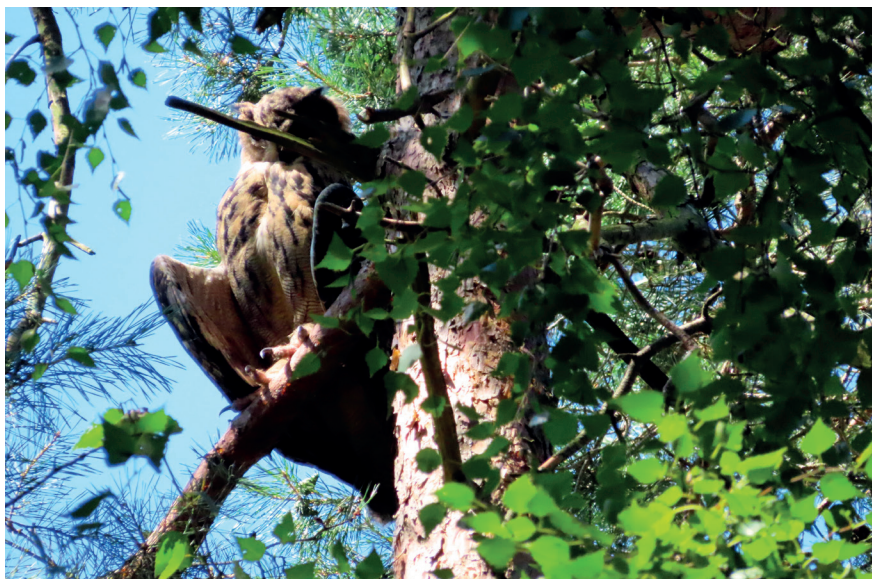
Foto 6. Een zonnebadende jonge Oehoe houdt de prooizoekende waarnemer in de gaten, 10 augustus 2023. Sun-bathing juvenile Eagle Owl observing the observer.

Als de snelle opmars van de Oehoe in dit tempo doorgaat en de neerwaartse trend van de Postduif ook hier doorzet, zou de Havik wel eens in de problemen kunnen komen. In Noord-Duitsland en in Westfalen ging de toename van de Oehoe gepaard met een gelijktijdige afname van de Havik en liepen territoria rond oehoenesten leeg (Busche et al. 2004, Chakarov & Krüger 2010). Gezien de explosieve toename van deze toppredator met z'n flexibele nestplaatskeuze (grote nesten, gebouwen en bodem) lijkt het niet nodig om Oehoes te faciliteren met het aanbieden van kunstmatige nestgelegenheden.