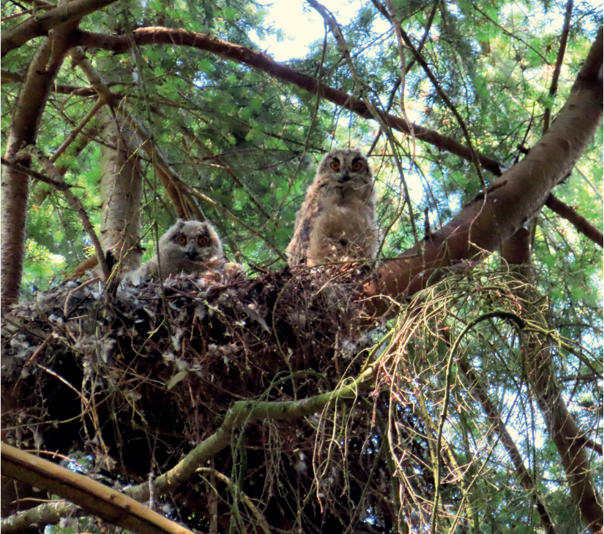
Foto 2. Jonge Oehoes op oud haviksnest, 16 juni 2023. Eagle Owl nestlings on old nest of Goshawk.

evenmin uit te sluiten dat, ondanks het feit dat ik nooit meer dan twee jongen tegelijk op het nest zag (maar waren dit steeds dezelfde?), er toch drie jongen waren. Mogelijk was er al een van het nest af (gevallen?) en zat dit ergens vlak bij de nestboom op de grond tussen de dichte ondergroei. Zodra ik me weer van de nestboom verwijderde, keerde de rust gelijk terug.