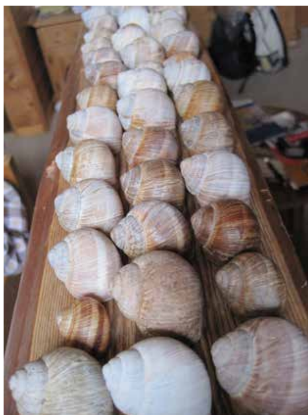
Fig. 1. Uitstalling lege wijngaardslakkenhuizen op hotelkamer.

en hun predatoren. Hij publiceerde enkele jaren geleden een uitstekend overzichtsartikel met een lange referentielijst (Vermeij, 2015). Over reparatie bij landslakken schreef ik al eerder (Cadée, 1995, 2015 en referenties daarin). Als het echter om zware beschadigingen gaat, zoals soms bij Wijngaardslakken, is het moeilijk voor te stellen dat de predator de slak niet heeft geconsumeerd. Reden dus om naar andere oorzaken van de beschadigingen te zoeken.