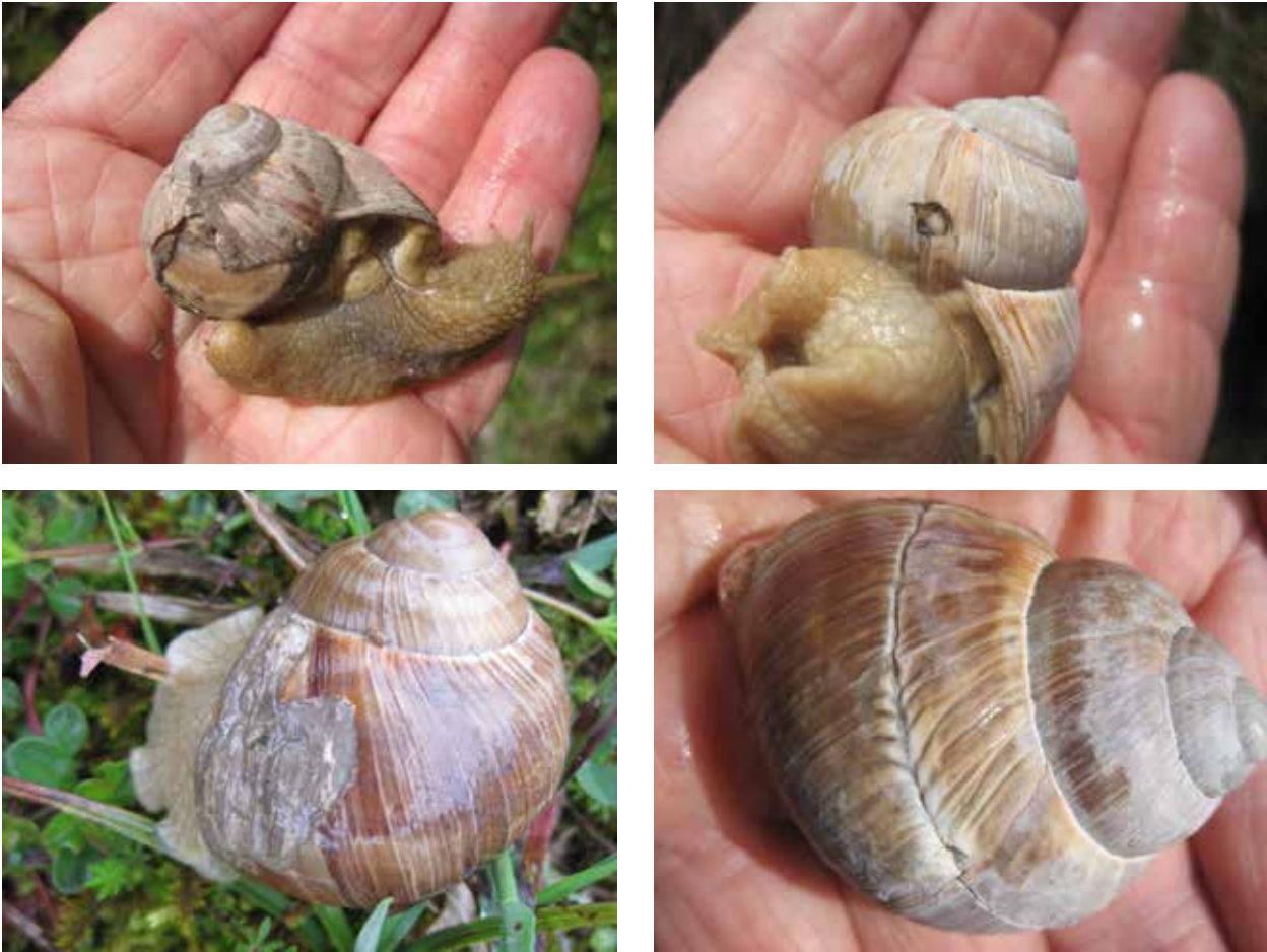
Fig. 2. Beschadigde en weer gerepareerde Wijngaardslakken. 2a. Groot nog niet gerepareerd gat in laatste winding. 2b. Klein gerepareerd gat. 2c. Mondrand beschadiging gerepareerd. 2d. Groef in schelp door beschadiging mantelrand.

de plaatsen zorgden wind en storm voor transport en daarmee voor een deel van de schelpbeschadigingen.