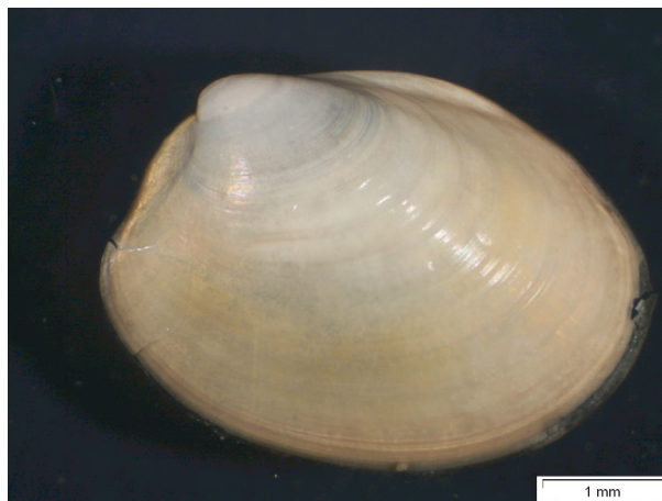
Fig. 4. Binnen- en buitenzijde van de Dunne parelmoerneut Ennucula tenuis afkomstig van de Oestergronden, loc. OYS13, 17 maart 2015. Foto's Ton van Haaren.

ten zuiden van het Friese Front veel minder diep is, is de kans op het vinden van de Dunne parelmoerneut daar vrij klein. De Dunne parelmoerneut wordt in lagere dichtheden aangetroffen dan de Driehoekige parelmoerneut. De Dunne parelmoerneut komt hoogstens in 51 individuen/m 2 voor, terwijl de Driehoekige parelmoerneut in dichtheden tot wel 167 individuen/m 2 kan worden gevonden.