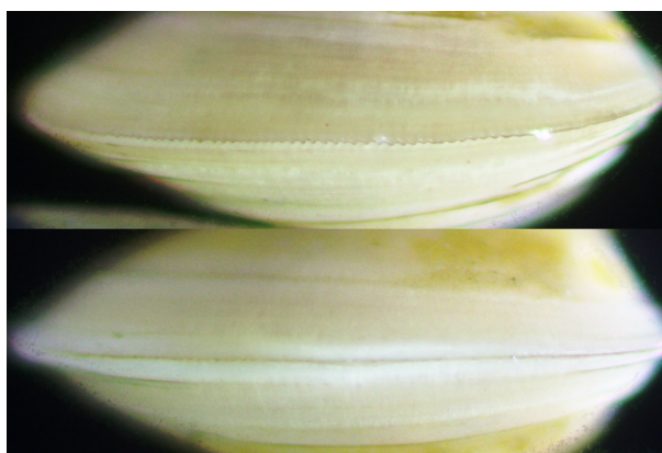
Fig. 1. Ventrale weergave van de Driehoekige parelmoerneut Nucula nitidosa (boven) en de Dunne parelmoerneut Ennucula tenuis (onder) waarbij duidelijk de gecrenuleerde rand te zien is bij de Driehoekige parelmoerneut; beide soorten zijn afkomstig van dezelfde locatie op het Friese Front (loc. 09, 29 maart 2007).

In 1989 is het BIOMON programma van mariene wateren opgezet om de variatie in de tijd van alle mariene ecosystemen binnen het Nederlands Continentaal Plat, inclusief de Waddenzee en de Zuidwestelijke Delta, te bestuderen. Dit monitoringprogramma is gestart op initiatief van het Rijksinstituut voor Kust en Zee (RIKZ) en later omgedoopt tot MWTL. Binnen dit programma worden regelmatig de bodemfauna, het fytoplankton, vissen, zeegras, zeevogels, zeezoogdieren van de Noordzee en de vegetatie op kwelders gemonitord. De coördinatie van het monitoringprogramma is tegenwoordig in handen van Rijkswaterstaat-Centrale Informatiediensten (RWS-CIV). Van 2006 tot 2018 was Eurofins AquaSense (voorheen Grontmij team Ecologie) verantwoordelijk voor de implementatie, analyse en rapportage van de monitoring van bodemfauna in de Noordzee. De