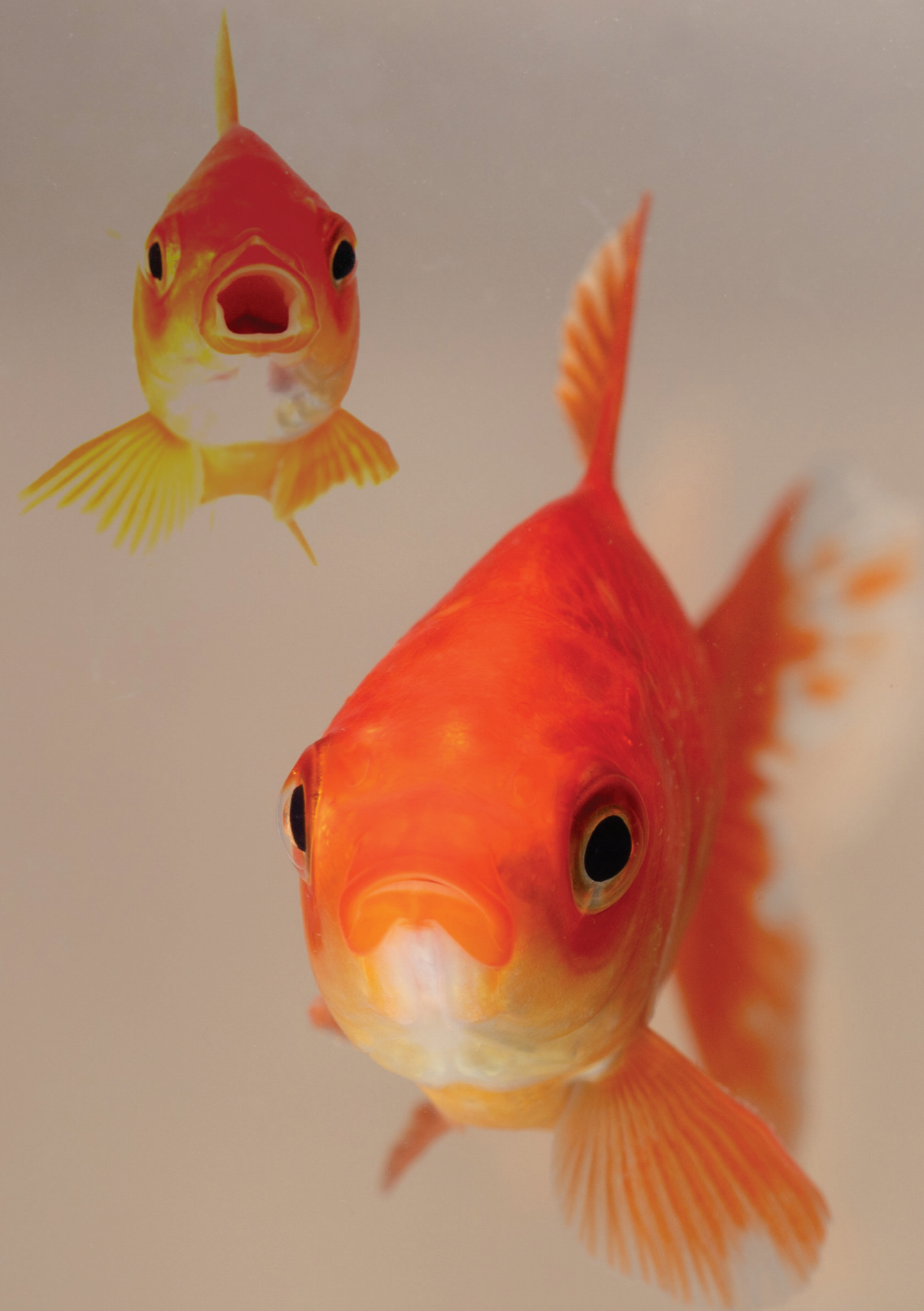
Figuur 3. Goudvissen.