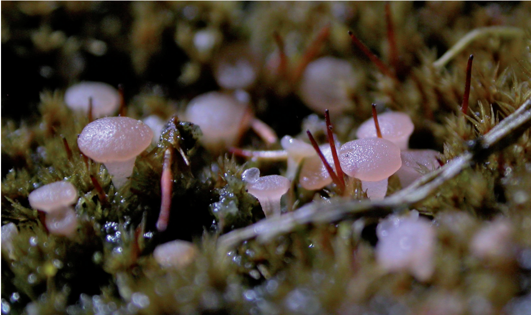
Figuur 2. Roseodiscus formosus tussen Purpersteeltje ( Ceratodon Purpureus ), Kienveen , leg. M. Gotink.

zijn? Navraag bij mycologen uit verschillende Europese landen leverde geen alternatief op, zodat deze soort als nieuwe soort beschreven diende te worden. Na overleg met H.O. Baral en T. Richter is besloten om dit inderdaad te doen en werd de soort beschreven in het genus Roseodiscus Baral als Roseodiscus formosus Wieschollek, Helleman, Baral & T. Richter ( formosus = schoon, mooi, fraai) in het Zeitschrift für Mykologie (Wieschollek et al., 2011).