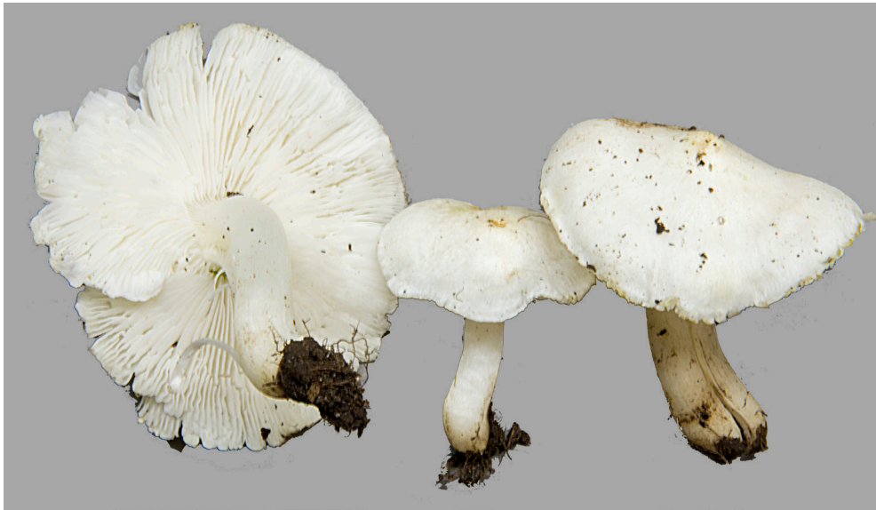
Figuur 4. Deze uit Groningen afkomstige collectie ridderzwammen bleek op basis van DNA analyse tot Tricholoma inocybeoides te moeten worden gerekend. Deze soort kan vooralsnog echter niet morfologisch van verwante soorten (uit het complex van de Zilveren ridderzwam, T. argyraceum ) onderscheiden worden, en wordt daarom niet bij de kartering opgenomen. Op klei, onder Abeel, Landgoed Rusthoven, Eekweerderdraai, 9 sept. 2017.

het melden van Antrodiella faginea hebben wij een sl-soort A. semisupina sl, incl. faginea , onychoides in het leven geroepen (zie Kartingsnieuws 6, Veerkamp & Dam, 2017). Op dat moment hadden we A. semisupina (0255040) op inactief moeten zetten, maar dat hebben we verzuimd en gaan we nu alsnog doen. Na het aanmelden van A. leucoxantha lijkt het ons juist om deze soort ook aan de sl-soort toe te voegen. Alle waarnemingen van A. semisupina sensu Standaardlijst 1995 en 2013 vallen nu onder de sl-soort met de volgende code en naam: 0255049 Antrodiella semisupina sl, incl. semisupina sensu auct. neerl. (Stl 2013 code 0255040), faginea , leucoxantha , onychoides . Later kunnen daar dan eventueel A. pallescens en de echte A. semisupina , wat overigens niet erg waarschijnlijk is, aan worden toegevoegd. Ingewikkelde materie, maar dergelijke veranderingen zullen in de toekomst steeds vaker nodig zijn.