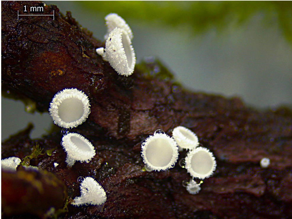
Figuur 7. “Gewoon” frankjelijke op dode takjes van struikhei op landgoed Groot Heidestein.