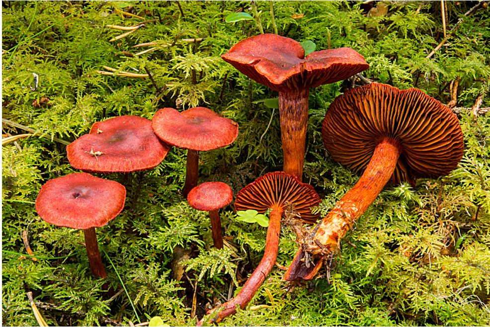
Figuur 2. Bloedrode gordijnzwammen ( Cortinarius sanguineus ss. lato) in een vochtig fijn-sparrenbos in midden-Zweden, eind augustus 2016.

erkende. Hij onderscheidde bovendien nog een aparte variëteit van “ Dermocybe ” sanguinea , namelijk var. vitiosus . In de Funga Nordica (Knudsen & Vesterholt, 2012), die op dit moment waarschijnlijk de meest populaire funga is, en haar voorloper, Nordic Macromycetes (Hansen & Knudsen, 1992) wordt C. puniceus niet genoemd, de andere twee taxa wel.