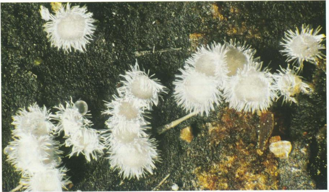
Figuur 3. Pseudolasiobolus minutissimus : vruchtlichamen.

Overigens bestaat er al een Flagelloscypha minutissima (Burt) Donk (Klein zweephaarschijfje), maar die soort heeft niets met P. glomerulata / P. minutissimus te maken. En, om het nog lastiger te maken, er bestaat behalve Peyronelina glomerulata ook een Peyronellaea glomerata , een bladparasiet die op veel verschillende planten kan voorkomen en die tot de Ascomyceten behoort. Als Nederlandse naam voor P. glomerulata is Gekruld zweephaarschijfje vastgesteld.