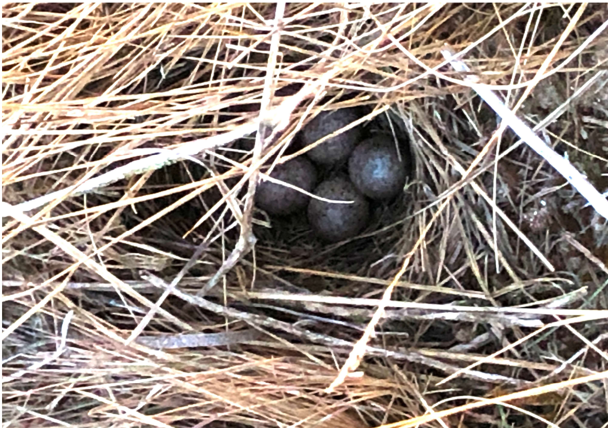
Nestje van Boomleeuwerik

In de exclosure kunnen we het positieve effect van minder/geen begrazing zien. Herstel van bomen en struiken en een toename van het aantal vogels (en Reeën!).