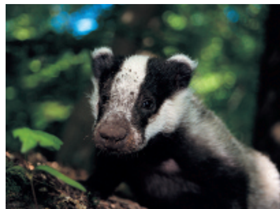
Ook jonge dasjes houden al van graven.