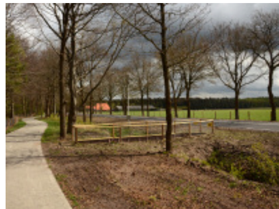
Faunapassages laten dassen veilig de overkant bereiken.