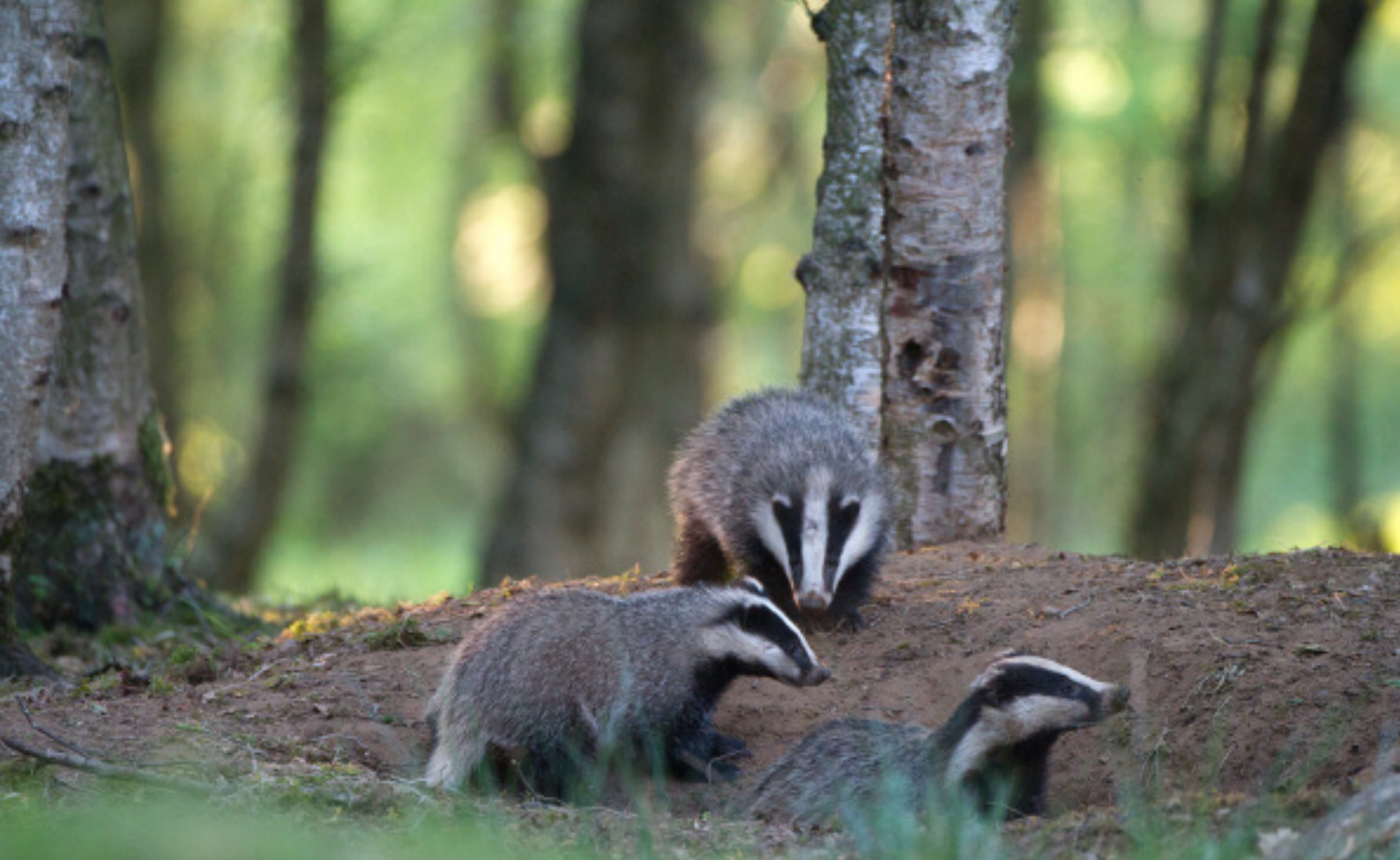
Dassenzeug met jongen op de burcht.