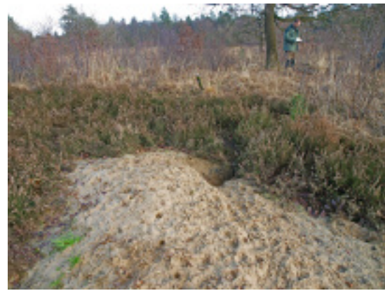
Inventarisatie van een dassenburcht. Getrainde waarnemers noteren informatie over dassenactiviteit.

In het 'Jaar van de Das' zijn veruit de meeste burcht-waarnemingen doorgegeven door de leden en waarnemers van de provinciale en regionale werkgroepen, waarvoor veel dank!